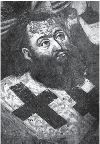
Петро Могила, фрагмент фрески в церкві Спаса на Берестові у Києві

Після смерті митрополита Йосифа IV Рутського Києво-галицьку митрополію перейняв єпископ-помічник із правом наслідства, турово-пинський єпископ Рафаїл Корсак (1637–1641), син білоруського шляхетського роду. Рафаїл, спершу прихильник Кальвіна, (народжений приблизно 1600 р.) згодом вступив до Василян, освіту набув в Західній Європі, в Брунсбергу, Празі і Римі, був одним з найближчих співробітників митрополита Йосифа IV.