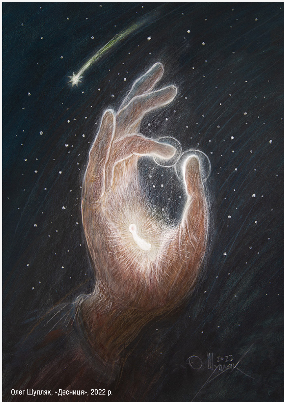
Олег Шупляк, «Десниця», 2022 р.

Ба більше, наша Церква має прадавню традицію, за якою вірні готуються до празника Христового