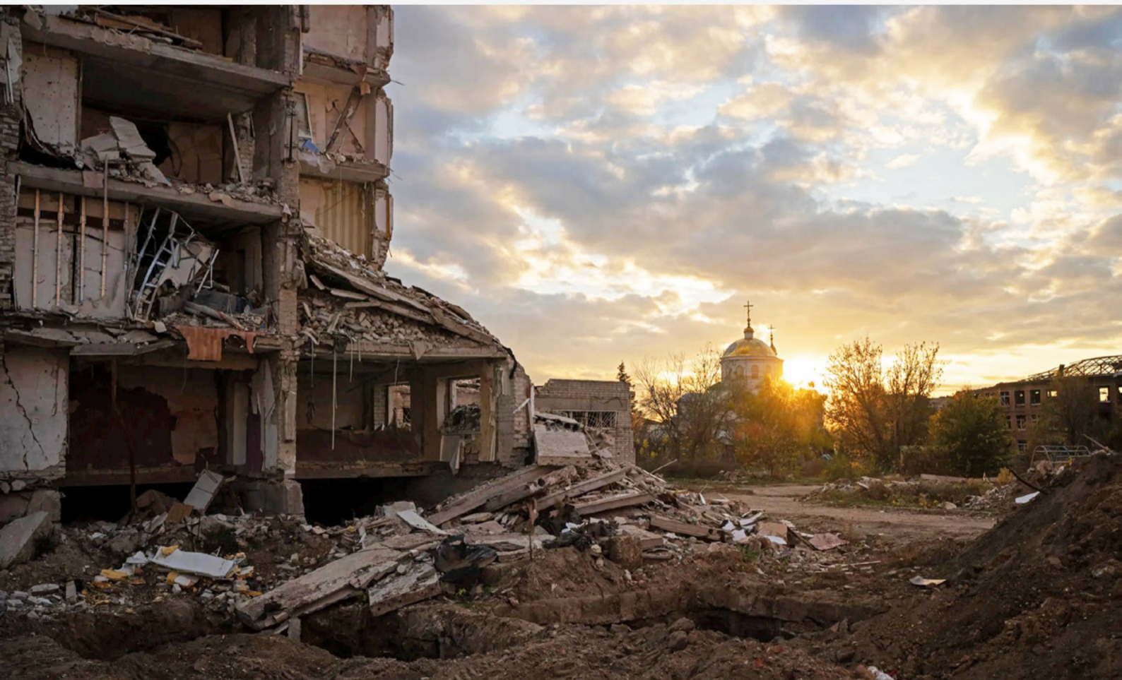
«Обличчя російсько-української війни», 24.10.2023 р. Захід сонця у зруйнованому Ізюмі Харківської області. Російські загарбники захопили місто у перші дні війни. Ізюм повернувся під контроль ЗСУ під час українського контрнаступу у вересні 2022 року.

Я не можу продовжувати писати «уявіть», коли я сам бачив ці ями смерті. Я не можу говорити «уявіть», коли моїх знайомих авторів убивають за те, що вони представляють українську культуру. Я не можу залишатися спокійним, коли читаю, що російська держава хвалиться тим, що забрала 700 тисяч українських дітей на русифікацію, коли щодня російські пропагандисти дають зрозуміти, що російські цілі – це війна на цілковите винищення. І все ж українці чинять опір і не здаються.