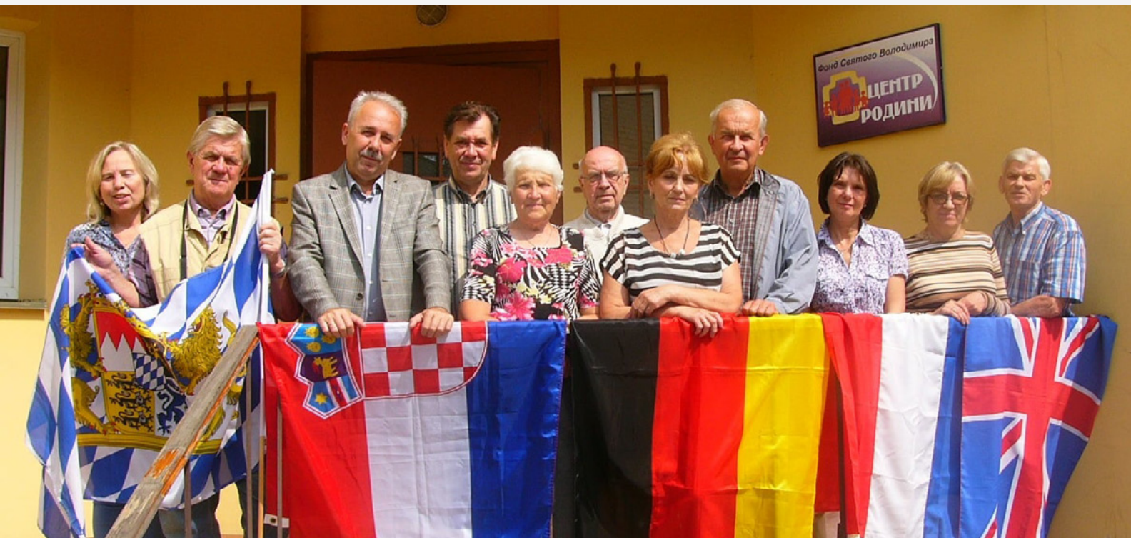
Спільнота Фонду з прапорами друзів