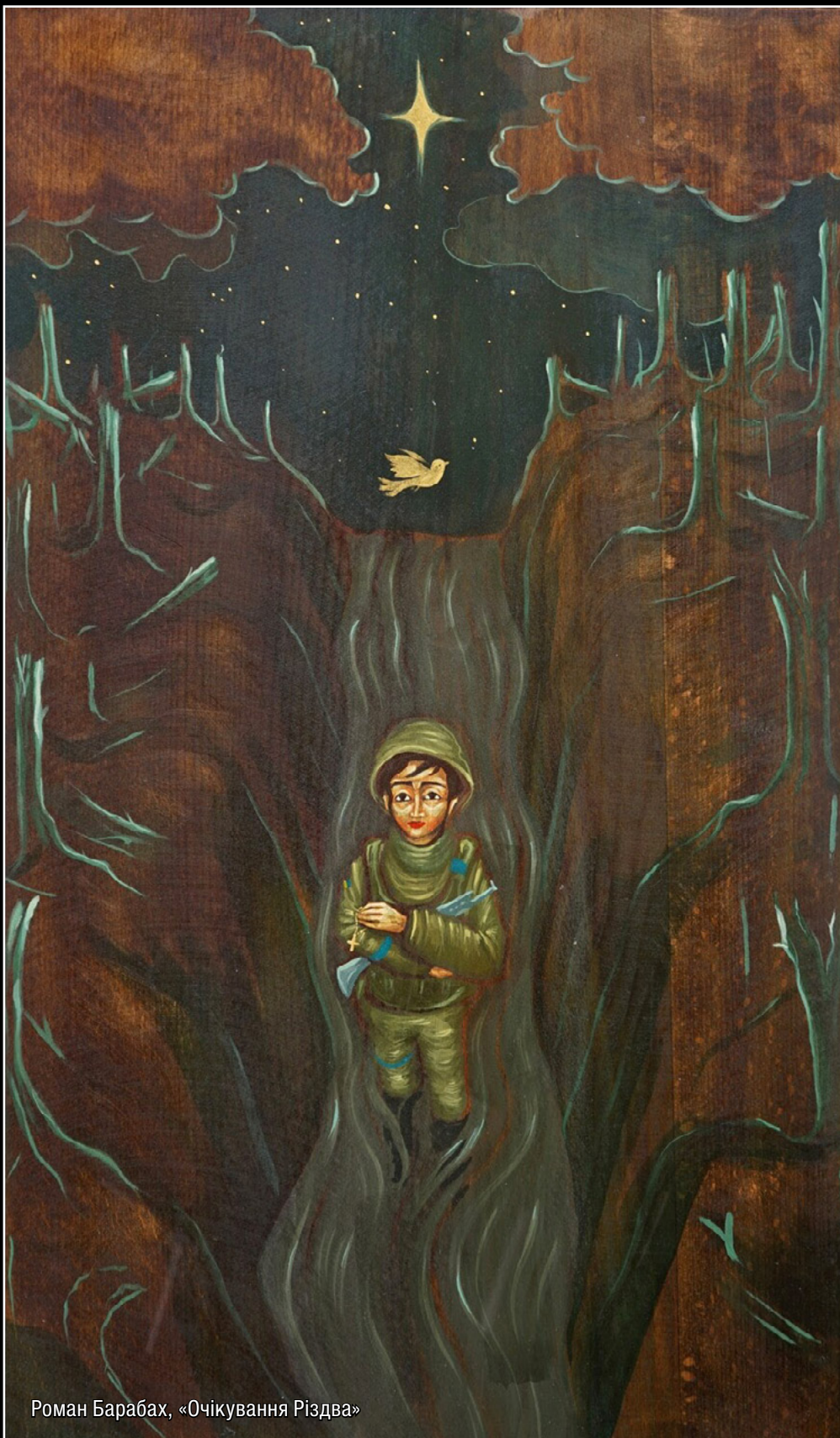
Роман Барабах, «Очікування Різдва»