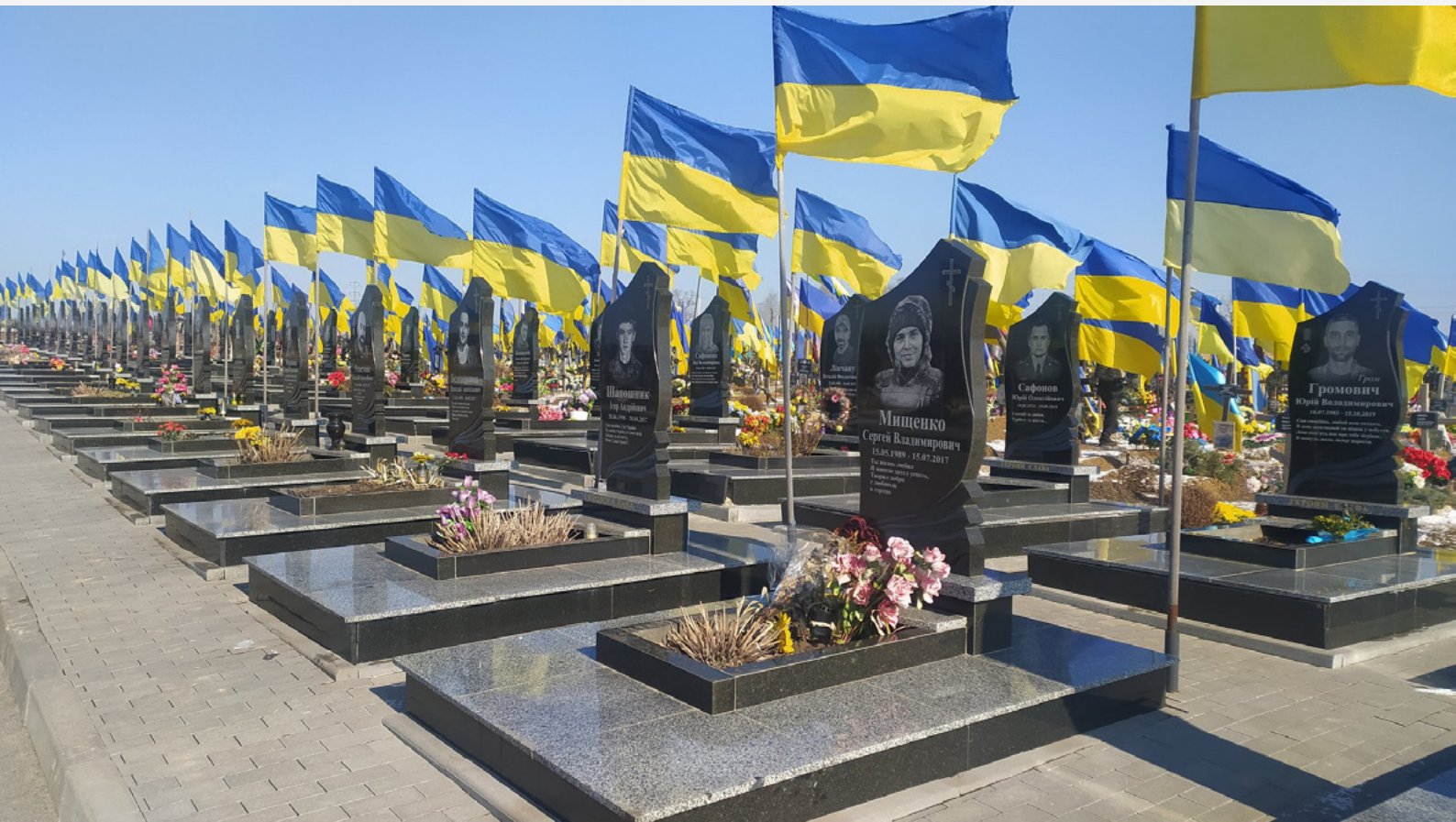
Алея Слави на кладовищі №18 у Харкові, 23 лютого 2023 року.