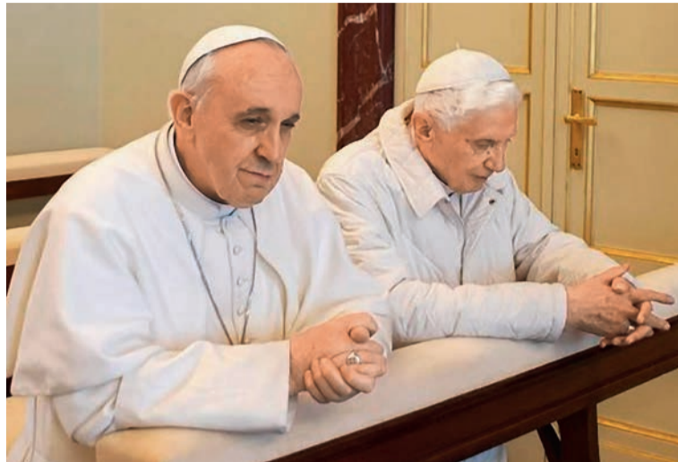
▲ Кастель-Гандольфо п. Риму, 23.03.2013 р. Зустріч Папи Римського Франциска з Папо-емеритом Бенедиктом XVI