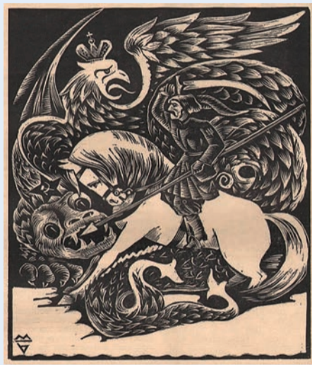
Алегорія боротьби України за незалежність Миколи Битинського. Журнал «Гуртуймося», ч. I (XIII), 1935 р.

Я далекий від героїзації війни. Геройство на ній сусидить з мародерством. Вірність – зі зрадою. Солідарність і взаємодопомога – з совковою бюрократією та дегуманізацією підлеглих. Війна – це кров, каліцтва, депресії, смерть і бруд. Це алкоголь, наркотики та контрабанда. Це те, що політкоректно називають «небойові втрати».