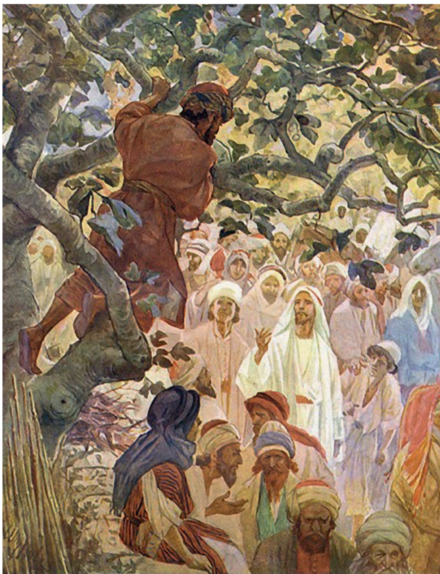
Вільям Гол (1846–1917), «Закхей на смоковниці»

Читанням історії про митаря Закхея свята Церква має намір приготувати нас до особливого часу очищення, покаяння і духовного зросту – Великого Посту.