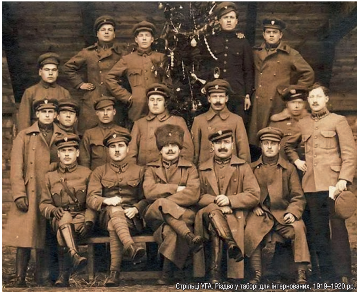
Стрільці УГА. Різдво у таборі для інтернованих, 1919–1920 рр.

Різдвяні свята у всіх слов'ян, крім москалів, і у всіх європейських народів справляються дуже вчисто і, крім торжественних церковних відправ, мають цікаві традиції, які коріняться в дуже глибокій давнині.