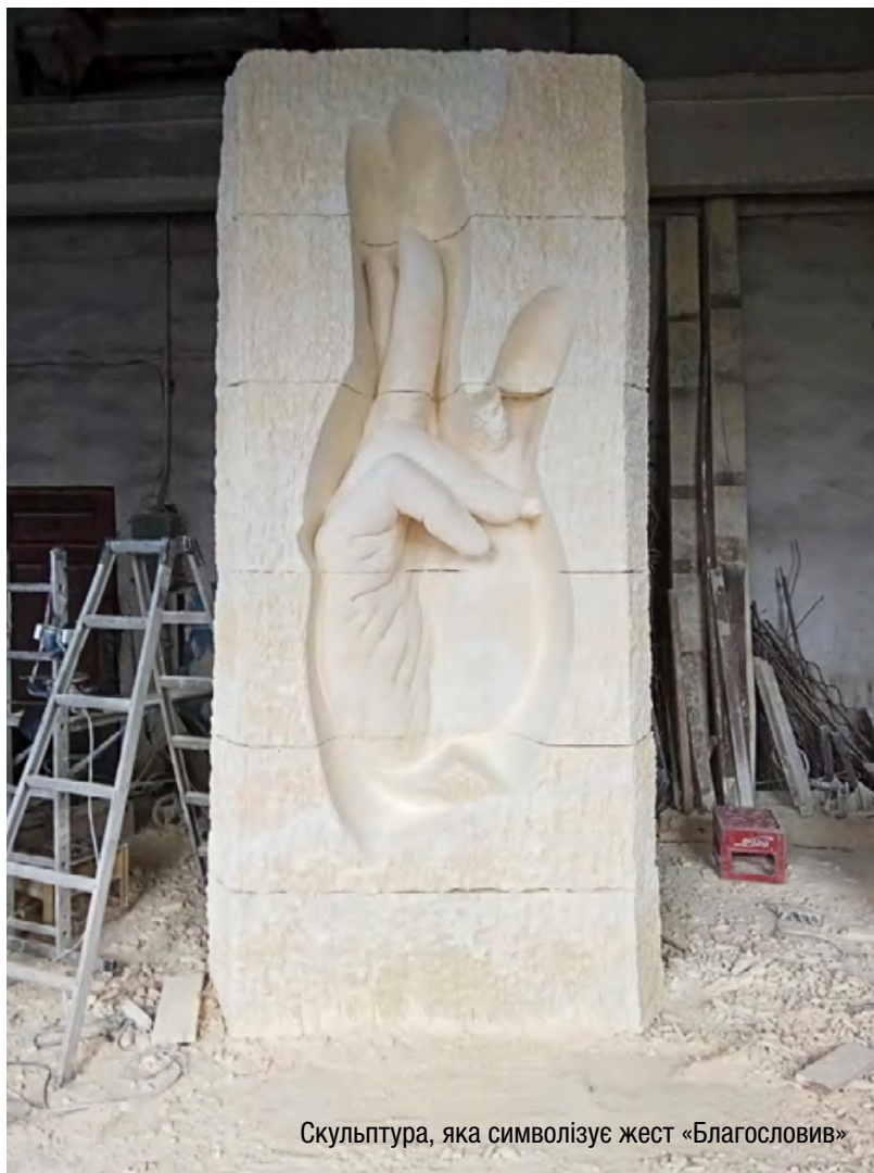
Скульптура, яка символізує жест «Благословив»

і радіє за тебе. Як добре буде принести свою дитину і поставити під це благословення. Як добре буде спертися на скульптуру "переломлення", знаючи, що для того, щоб я "переломався", мій Господь помер на хресті. Молімося на Божественній Літургії, входьмо у глибину Євхаристійної жертви, приймаймо цю благодать Тіла і Крові Господньої, щоб відновити розуміння того, ким ми є і наскільки Євхаристійним є ціле наше життя».