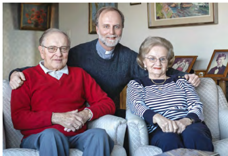
Владика Борис Гудзяк з батьком Олександром та мамою Ярославою.

Вл. Б. Гудзяк: Я добре ставлюся до добрих уроків християнської етики і думаю, що непогано, коли є можливість ці уроки проводити.