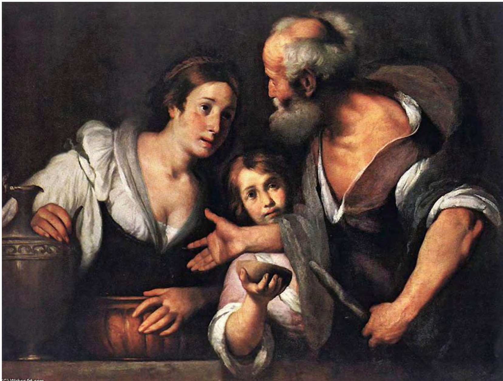
Бернардо Строцці, (бл. 1581-1644), «Пророк Ілля та вдова із Серепти»

Ісусова поведінка охоплює усі виміри Його особи: Він бачить, милосердиться і зцілює. У своїх діях Ісус не зупиняється на півдорозі. Натомість учні, які теж побачили цю силу народу, вони зауважили його нужду, його фізичний голод. Можливо, навіть відчували жалощі до цих людей, хоч, смію припустити, ці жалощі, це співчуття не сягнуло глибин їхнього ества, їхнього серця. Чому так думаю? Бо учні не були готові чимось пожертвувати задля цих людей, зробити щось конкретне, щоб допомогти їм, навіть відмовившись від власного комфорту. Вони, натомість, вирішили «вмити руки», вдати, що ці людські земні проблеми їх не стосуються, що люди мусять самі давати собі раду, хто як може, то ж пропонують Ісусові і людям свій досить дешевий «рецепт» вирішення проблеми: «Відпусти людей, нехай ідуть по селах та куплять собі поживи».