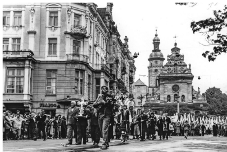
▲ Львів, 17 вересня 1989 р., багатотисячний маніфест греко-католиків з вимогою легалізації УГКЦ.