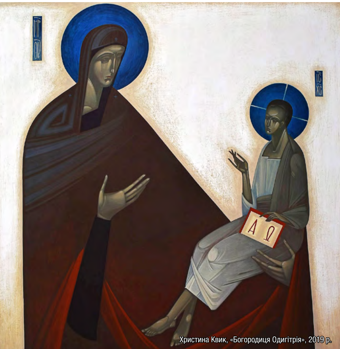
Христина Квик, «Богородиця Одигітрія», 2019 р.