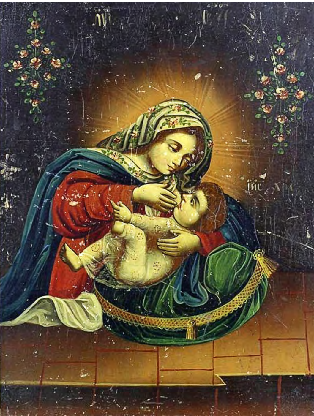
«Богородиця Годувальниця», кін. XIX ст., південно-західна Київщина, Український центр народної культури «Музей Івана Гончара»

Сьогодні Христова Церква святкує перше в літургійному році найбільше свято, яке належить до 12-ти найважливіших святкових, духовних, літургійних моментів життя Церкви. Сьогодні ми святкуємо свято Різдва Пречистої Діви Марії. Недаремно те свято начебто відкриває нам новий літургійний рік; недаремно серед усіх свят його Церква поставила першим. Це тому, що вдумуючись в цю подію, намагаючись її збагнути нашим серцем, відкрити його духовний зміст, ми бачимо, що сьогодні є свято народження християнської надії.