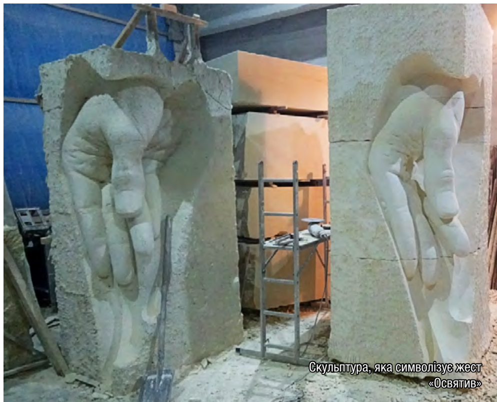
Скульптура, яка символізує жест «Освятив»