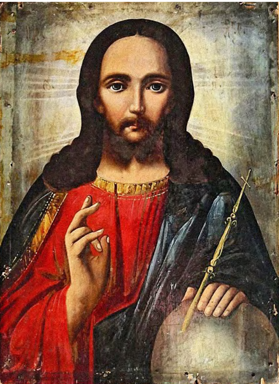
«Христос Вседержитель», XIX ст., Слобожанщина [Полтавщина]. Приватна колекція о. Зенона Хоркавого

Місяць вересень – не тільки календарний початок осені, нової пори року. Він має важливе значення для християн східного обряду. Саме 1 вересня (14 за новим стилем, світським календарем, тобто в ці дні) православна і греко-католицька Церква святкує початок, «новоліття», або «найменування» Нового церковного року, який розпочинає своєрідне коло літургійних богослужінь. Вересневий початок Нового церковного року характерний лише для Церков східної традиції. Церкви західного обряду розпочинають його першою неділею різдвяного посту (адвенту).