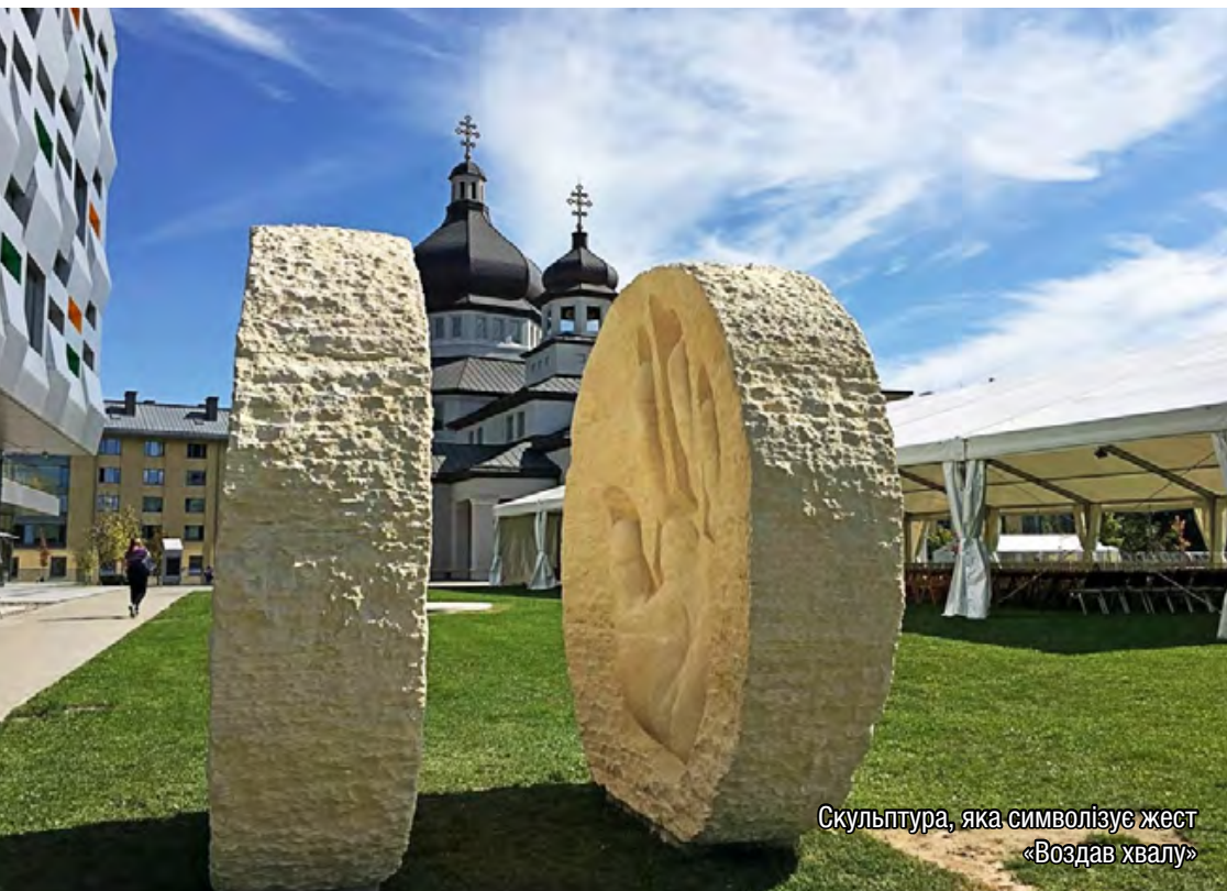
Скульптура, яка символізує жест «Воздав хвалу»