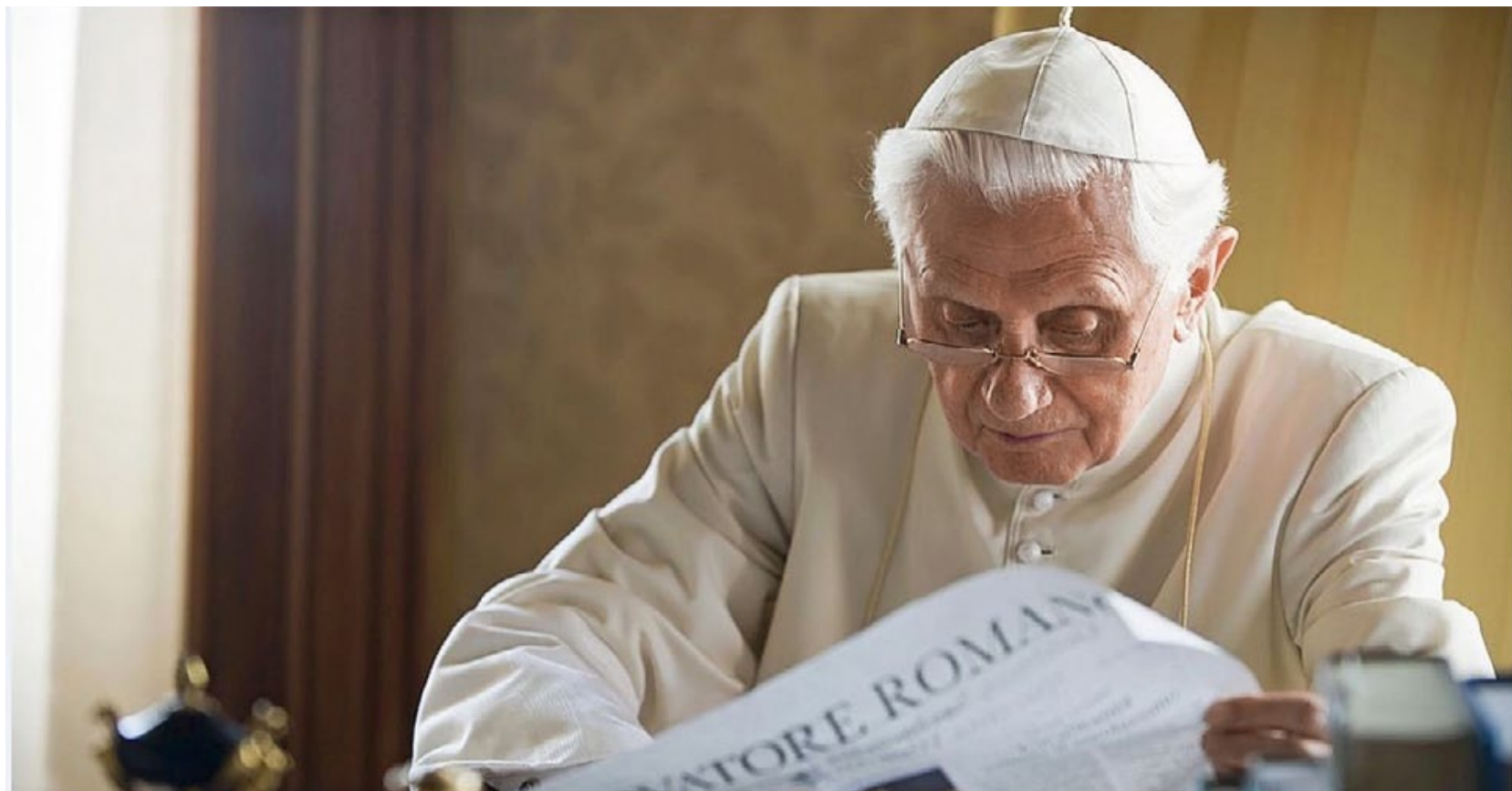
16.04.2020 р., виступив Папа Бенедикт XVI у свої 93 роки. Очолював Католицьку Церкву з 2005 по 2013 рік. Був 265 Папою. У цей день народження не приймав гостей у зв'язку із спалахом пандемії COVID-19.