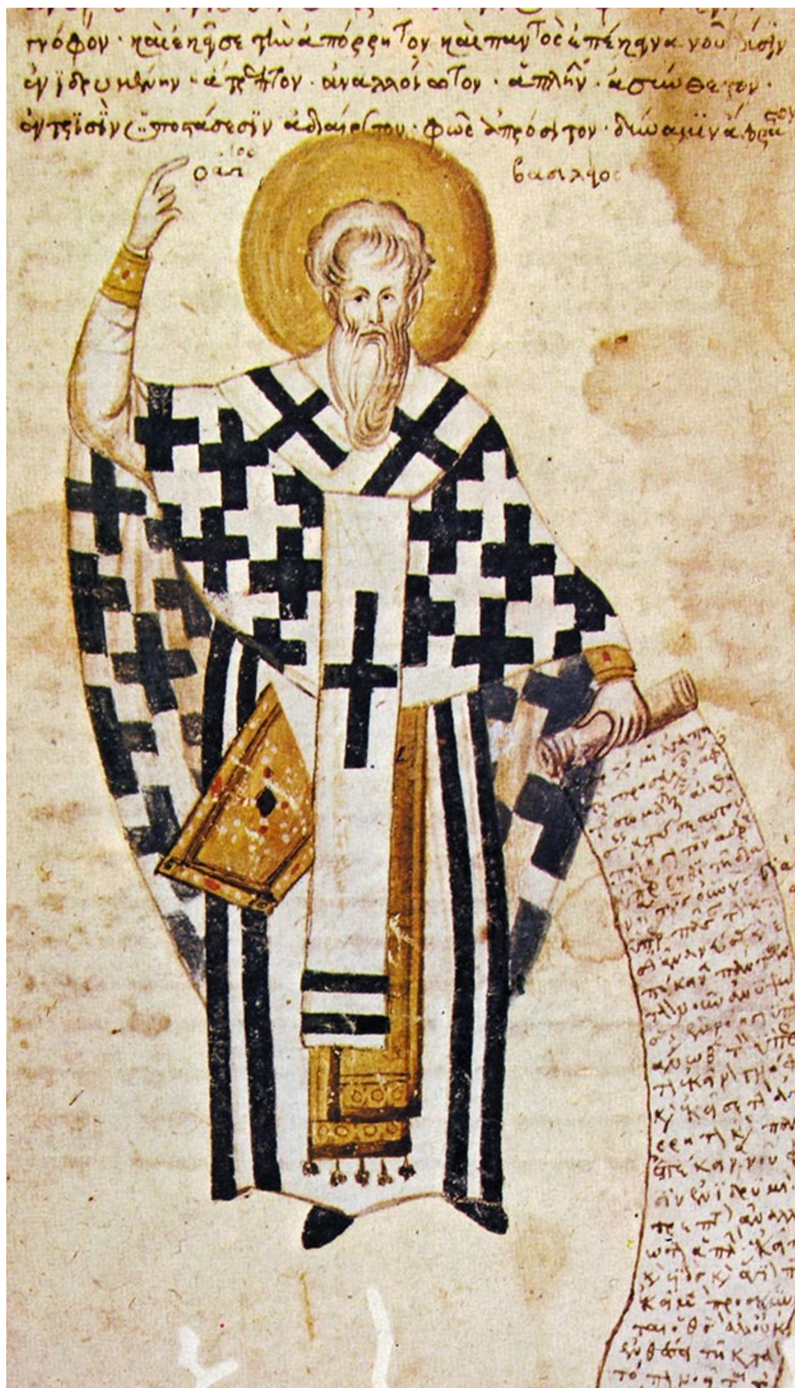
Святий Василій Великий, XV ст., Греція, Афон, монастир Діонісіат

З іншого боку, блаженна та дитина, котра мала щастя народитися і зростати у глибоко віруючій християнській сім'ї. Там вона отримала найбільший і найцінніший спадок, який батьки можуть залишити дітям і який може допровадити дитину до вершин людяності і святості. Ось як пише у своєму Заповіті ісповідник віри патріарх