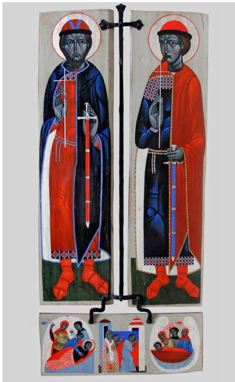
Остап Лозинський, «Борис і Гліб зі сценами життя», 2013 р.