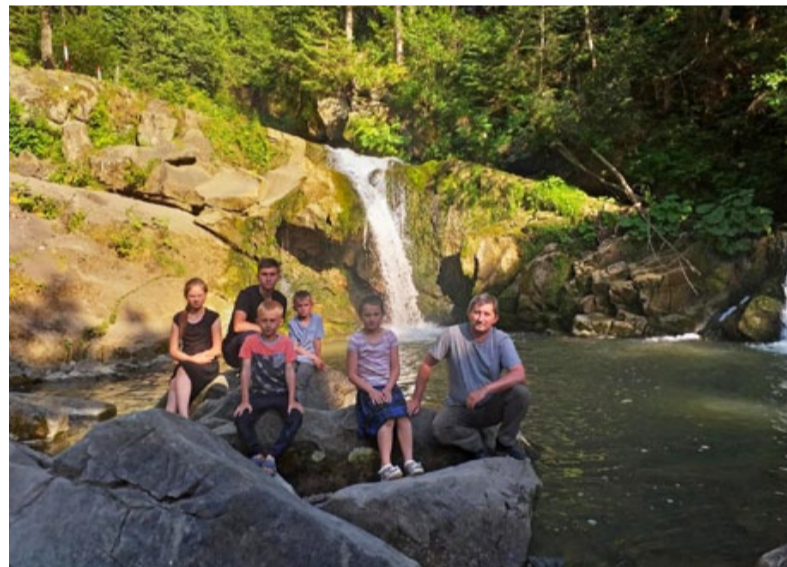
Діти мають різні смаки, проте допомагають батькам готувати; с-на: ФБ Веніамін Ціцей

Галина Ціцей: Разом поїхати відпочити – важкувато, бо в нас практично немає вільного часу. Але як якийсь церковне свято випадає, коли чоловік вихідний, можемо виїхати на природу. Маємо старий «бусик» для роботи, але й для сім'ї іноді підходить. А коли діти були менші, то ходили в парк, на гойдалки.