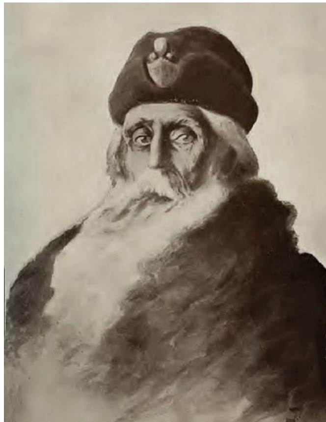
Князь Ярослав Мудрий, малюнок з книги Миколи Аркаса «Історія України-Русі», 1912 р.

Відсутність наявної святості все-таки ніяк не повинна породжувати у нас сумнівів, мовляв, її канонізова-