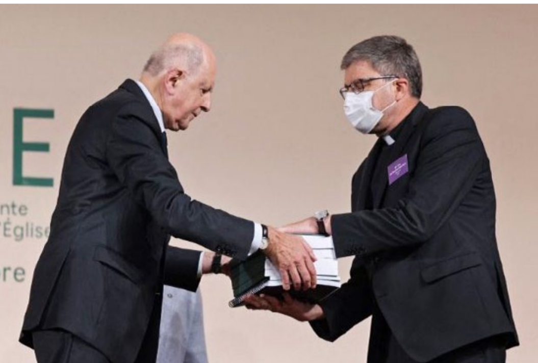
Голова незалежної комісії передає рапорт очільникові єпископату.

Відповідаючи на запитання журналістів, речник Апостольської Столиці зазначив, що Папа солідаризується з болем постраждалих від зловживань з боку духовенства та вдячний їм за готовність заявити про злочин.