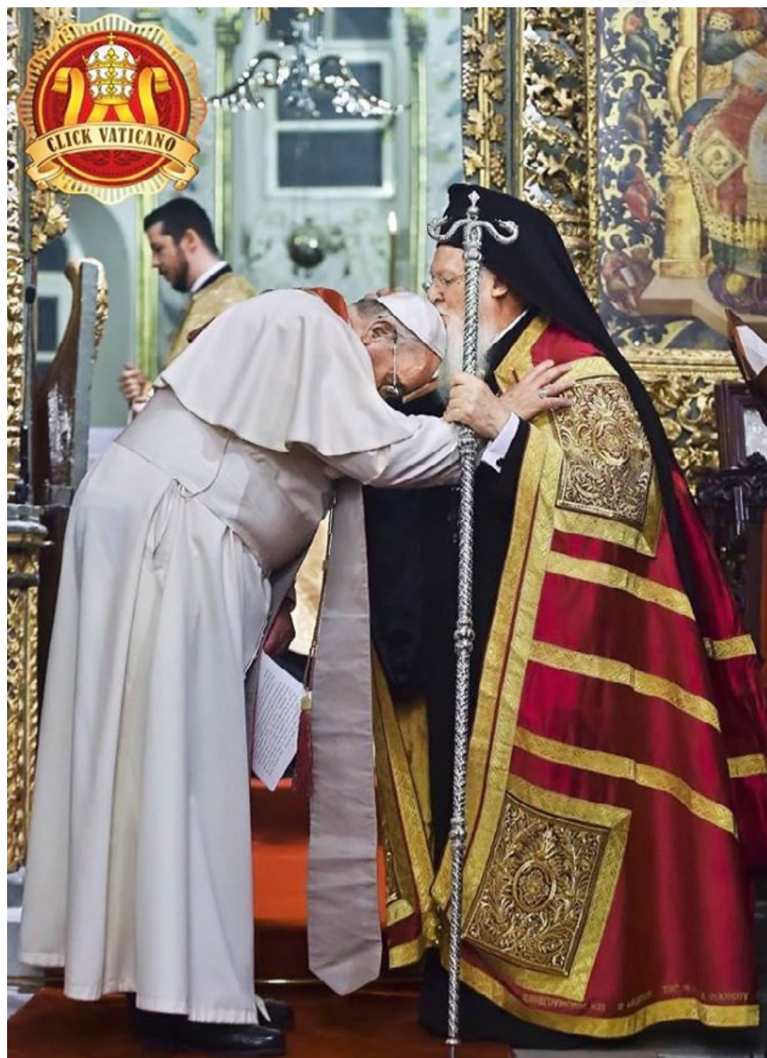
Вселенський патріарх Варфоломій цілує голову Папи Франциска під час екуменічної молитви в Патріаршій церкві св. Георгія в Стамбулі, субота, 29.XI.2014 р.

Водночас, коли роздумуємо про прощення, мир і соціальне порозуміння, то натрапляємо на слова Ісуса Христа, які нас дивують: «Не думайте, що я прийшов принести мир на землю. Не мир прийшов я принести на землю, а меч. Я прийшов порізати чоловіка з його батьком, дочку з її матір'ю і невістку з її свекрухою. І ворогами чоловіка будуть його домашні» (Мт. 10, 34–36). Святіший Отець підкреслює, що ці слова важливо розглядати в контексті даного розділу. Бо тоді стає зро-