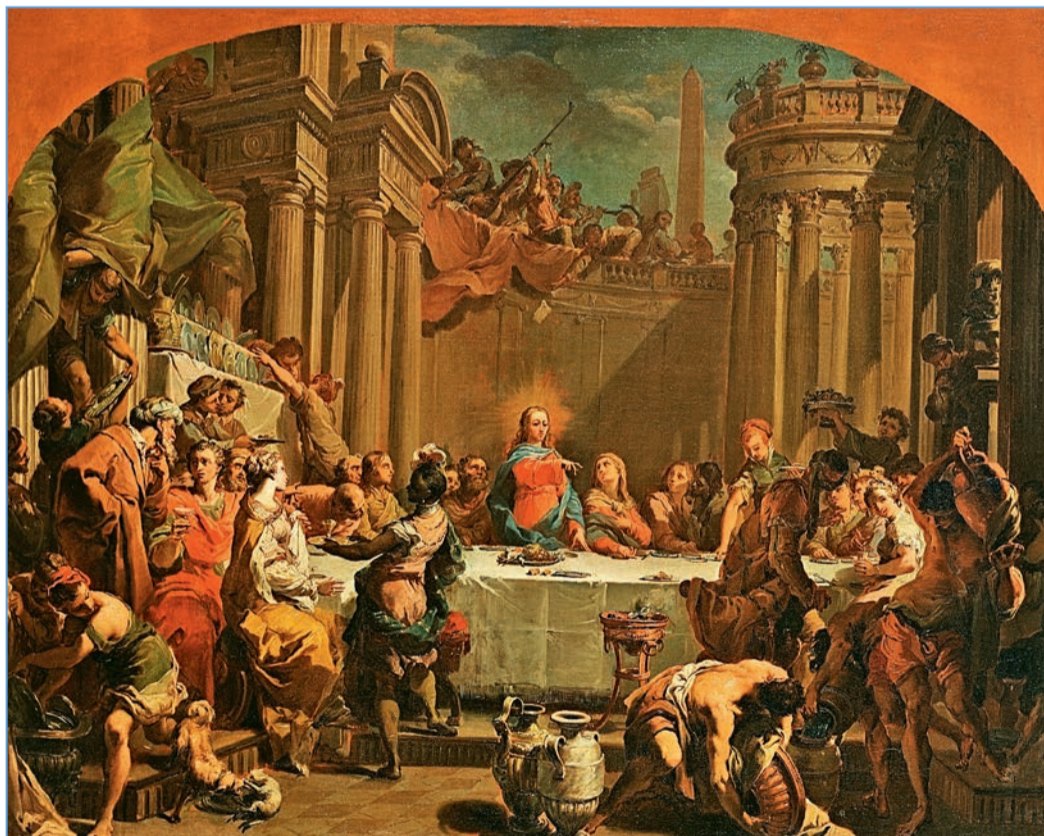
Гаєтано Гандольфі (1734–1802), «Весілля в Кані Галілейській», 1766 р.

Все таки Ісус не абсолютизує родину і не говорить, що вона є найбільшою цінністю на землі. Вищою від неї є воля Божа: «Хто виконує волю Богу, той Мені брат, сестра і мати» (Мк 3, 31–35). Таким чином