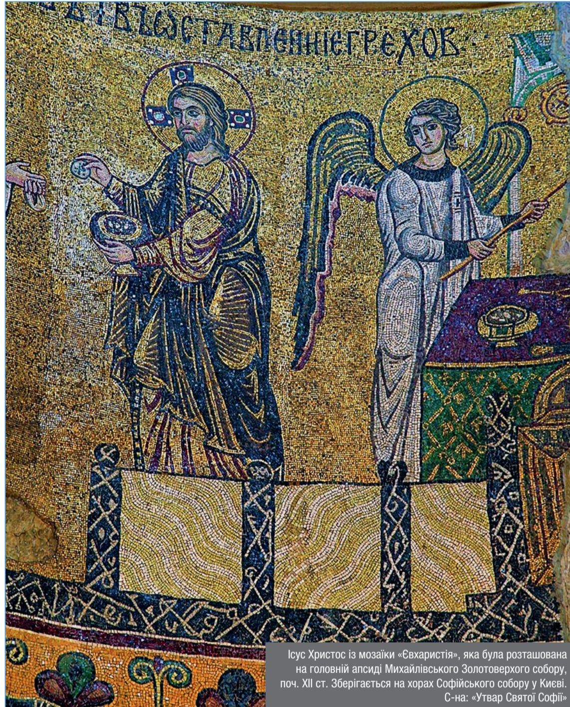
Ісус Христос із мозаїки «Євхаристія», яка була розташована на головній апсиді Михайлівського Золотоверхого собору, поч. XII ст. Зберігається на хорах Софійського собору у Києві. С-на: «Утвар Святої Софії»

Тоді як у Літургії св. Івана Золотоустого в скороченні подане діло відкуплення, то св. Василій Великий докладно подає як Бог Отець усіма способами старався піднести й спасти упалий рід людський: найперше через пророків,