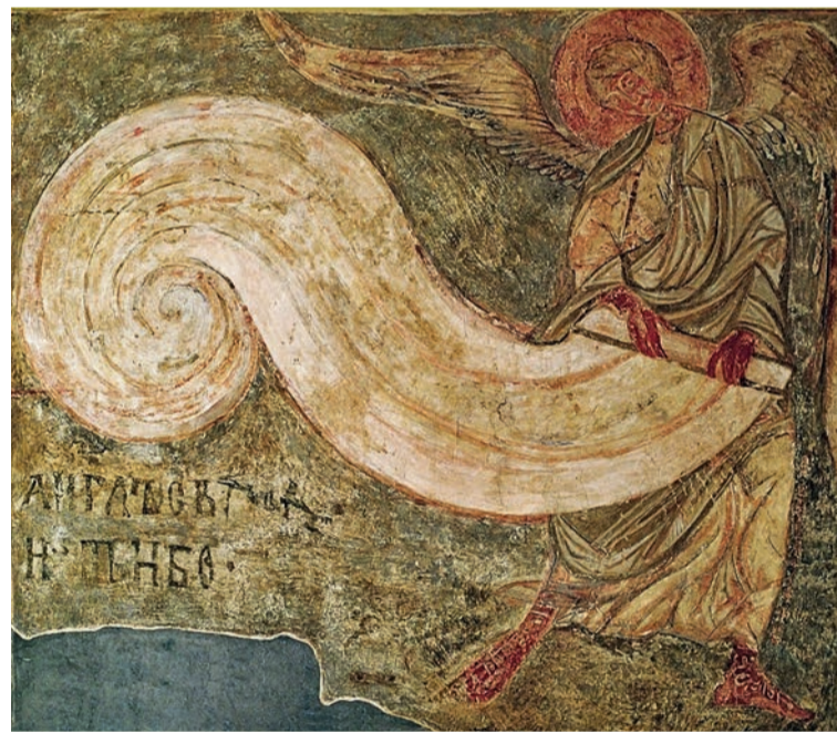
Кирилівська церква, фреска XII ст. На композиційному полі представлена фреска, вона відома як «Янгол, який згортає небо», – янгол стоїть посеред буревію, ледве втримуючи рівновагу, й виконує Божий наказ... «А як люди дізнаються, що час збиратись на Страшний суд? Всевишній покличе одного з янголів – і той буде згортати небо у сувій.» С-на та текст: Музей «Кирилівська церква»; Ірина Марголіна для RISU

У численних документах Церкви говориться, що часи антихриста вже настали. Його наступ перемаже не людина, а Бог. У книзі Одкровення мовиться, що триумф добра у подоланні зла набере форм Страшного суду (пор. Од 20, 12). Незважаючи на те, що Отець не послав Сина у світ судити, а світ спасти, все таки Отець Синови дав суд увесь (пор. Ів 5, 22). Отож, у цьому житті той, хто вірує в Нього, не буде засуджений, а хто не хоче вірувати в Нього, той уже засуджений (пор. Ів 3, 18).