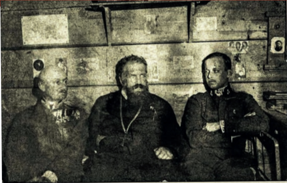
Ліворуч: барон Казимир Гужковський; митрополит Андрей Шептицький; ерцгерцог Вільгельм Габсбург. Село Кадлубиськ поблизу Бродів, зима 1917–1918 рр.

відомий прихильник українців, що й прибрав був український псевдонім Василь Вишиваний, помер в советському концтаборі у Владимирі, що лежить 160 км на схід від Москви. Василь Вишиваний