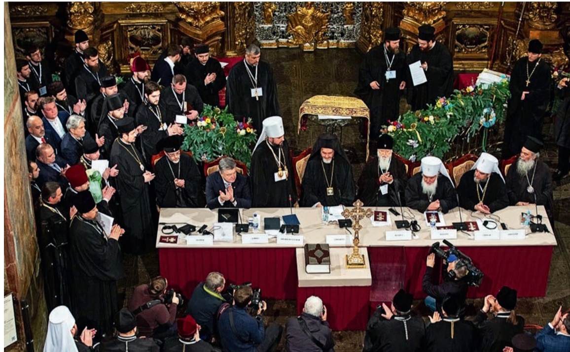
15.12.2018 р. у стінах древнього Софійського собору в Києві – кафедрального собору Київської Русі – відбувся об'єднавчий собор українських православних Церков, на якому обрали предстоятеля єдиної помісної Православної Церкви України, ним став митрополит Переяславський та Білоцерківський Епіфаній.

Проведення 15 грудня 2018 р. Об'єднавчого собору зі створення Помісної Православної Церкви та обрання її предстоятелем митрополита Епіфанія остаточно поклало край духовно-пануванню Москви в Україні, що продовжувалося понад три сторіччя. Така думка американського впливового видання Financial Times.