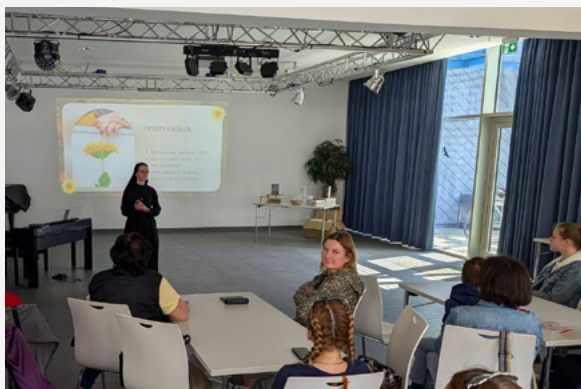
У Мюнстері відбулись реколекції