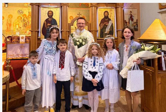
Перша Сповідь та Святе Причасття у Бамберзі