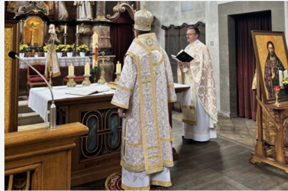
Перша Архиерейська Літургія на парафії у м. Ашшафенбург