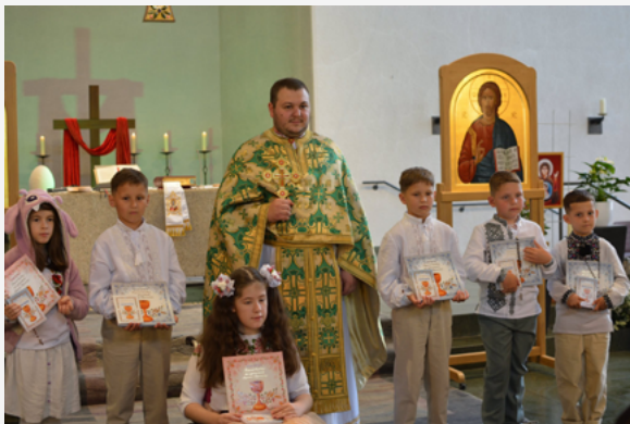
Аахен: Перша Сповідь та Святе Причастя