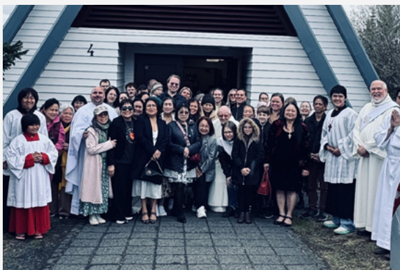
Католицька спільнота Рейк'явіка відсвяткувала 25-річчя освячення храму Maríukirkja разом з українцями