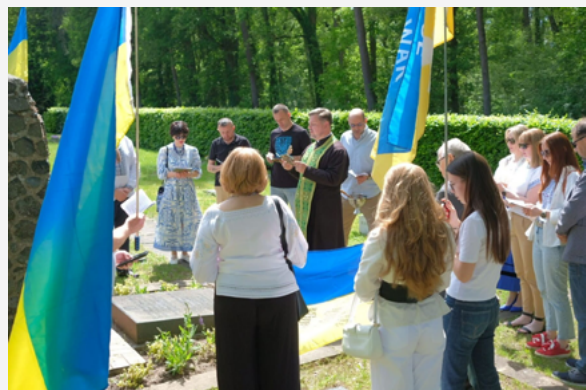
Гамбург: молитва за українців, які спочили на чужині