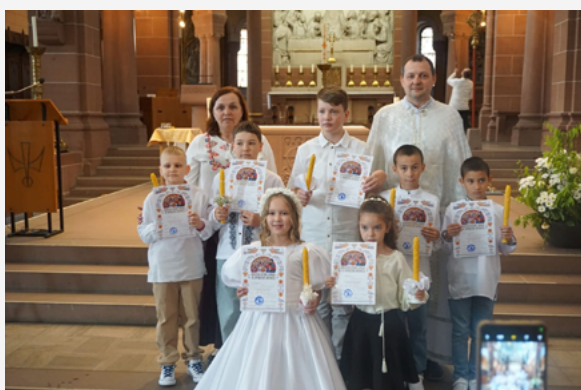
Перша Сповідь та Святе Причасття у парафії святого Йосафата в Карлсруе