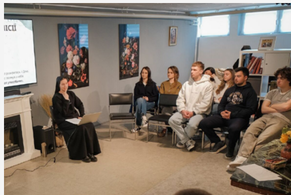
Місії на парафії Всіх Святих у Гамбурзі