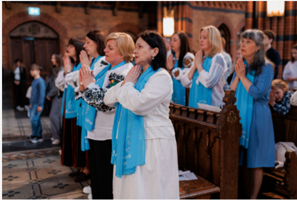
У Стокгольмі спільнота «Матері в молитві» поповнилася новими членkinями