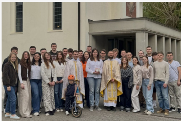
«Історія УСпіху» — християнський курс для молоді Кельна та Дюссельдорфа