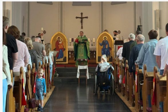
Парафіяльний празник у Вайле