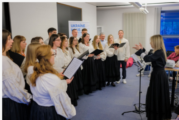
Голос українців звучав на кінофестивалі «Culture vs War»