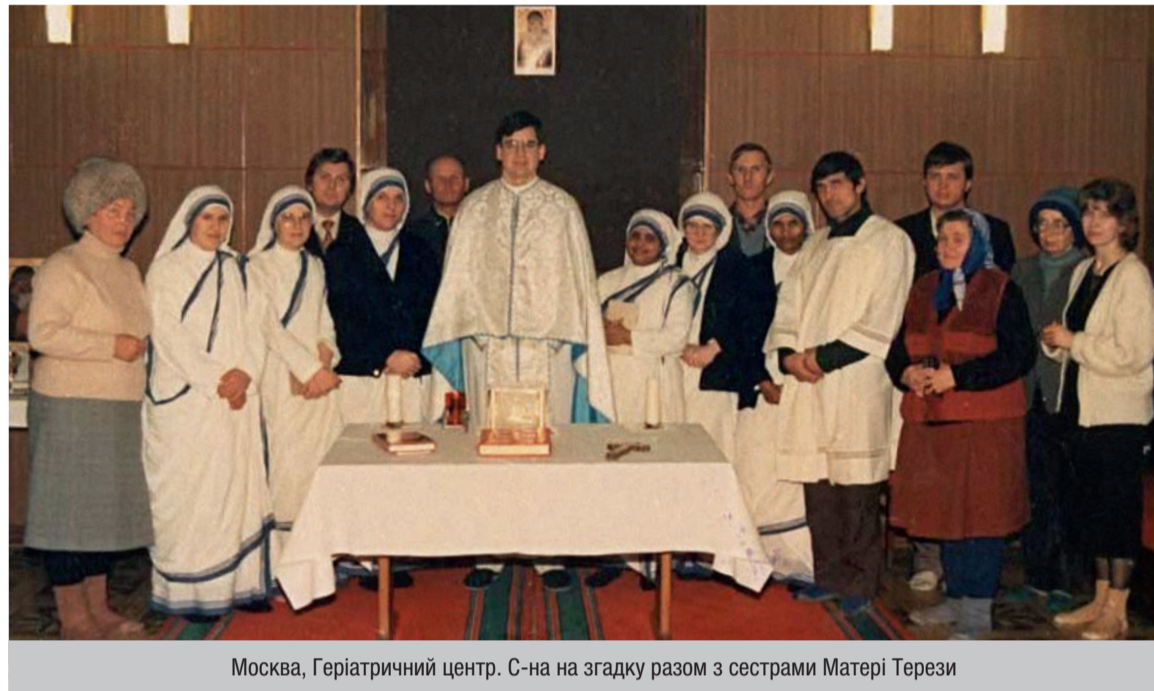
Москва, Геріатричний центр. С-на на згадку разом з сестрами Матері Терези

Для нас значення спілкування з добродішними дітьми матері Терези перевищувало межі людських цінностей. Після оскаженілої нагінки міліції та спецназів, що чудово замінили історичне ЧК, у тихій скромній чернечій обителі ми переставали бути загнаним звіром, ми знову ставали людьми. Після Літургії, яку отець Брайєн-Колодїйчук відправляв по суботах та неділях у нашому, греко-