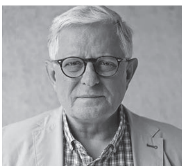
С-на: Міколай Стажиньскі, «Ньюсвік» (Польща)