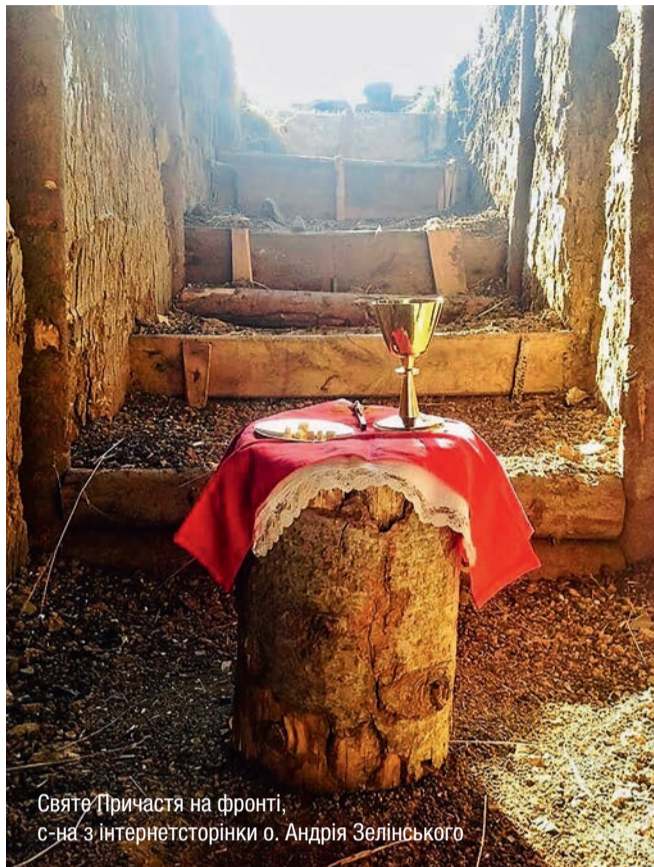
Святе Причастя на фронті

Ми свідомі того, що історія таїнства Христового вочленення незрозуміла для людських роздумів, яку треба приймати, як Господь нам об'явив, себто вірити. Так само вірити у Божі об'явлення, як це здійснювала Мати Божя, Якій ангел Господній об'явив про непорочне зачаття, чи, як це, також робив обручник св. Йосиф, якому ангел Господній «у сні явився йому, кажучи: Йосифе, сину Давидів, не бійся прийняти Марію, жону твою, бо зроджене в ній є від Духа Святого» (Мт. 1, 20). Це не було легко прийняти Йосифові, зрозуміло. Але Йосиф і Марія повірили Божому слову, що його ім звістив ангел Божий.