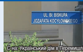
С-на: Український дім в Перемишлі

Під час засідання міської ради польського Перемишля було прийнято постанову про скасування вулиці, що носила ім'я Йосафата Коциловського. Одним із головних закидів проти Блаженного була нібито неояльність щодо польської держави та співпраця з німецьким окупантом. 24.04.2001 р. у Ватикані відбулося проголошення декрету мучеництва єпископа Йосафата Коциловського. Обряд беатифікації відбувся 27.06.2001 р. у Львові під час Святої Літургії у візантійському обряді за участі Івана Павла II. Йосафат Коциловський (1876–1947) – єпископ Перемишльської єпархії УГКЦ (1917–1947). Після Другої світової війни арештований радянською владою, помер у Лук'янівській тюрмі у Києві. (Історична правда)