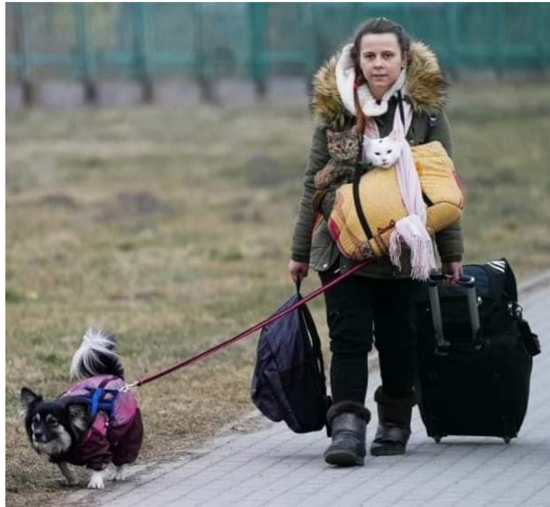
Жінка, яка 13 березня пересікла кордон з Польщею із усім тим, що змогла зберегти. Спаковано все життя...

У програмі Блаженніший Святослав звернувся до жителів центральної та західної України із закликом бути гостинними до біженців. «Мені так приємно, коли люди відкривають не тільки свої домівки, а й свої серця перед людьми, які змушені покинути свій дім і місто, рятуючись від війни. Прошу всіх, хто нас слухає: прийміть ваших братів і сестер! Не картайте їх за те, що вони, можливо, не так говорять українською, як ви, чи не так глибоко розбираються в істині християнської віри, а чи мають інші політичні переконання, – попросив Глава Церкви і додав: — Коли ви стримаєте суперпатріотичне почуття з поваги до того, хто вихований у зовсім іншому світі, – це буде вашим особливим постом, яким ми відбудуємо глибоку гармонію українського суспільства, а відтак єдність нашого народу».