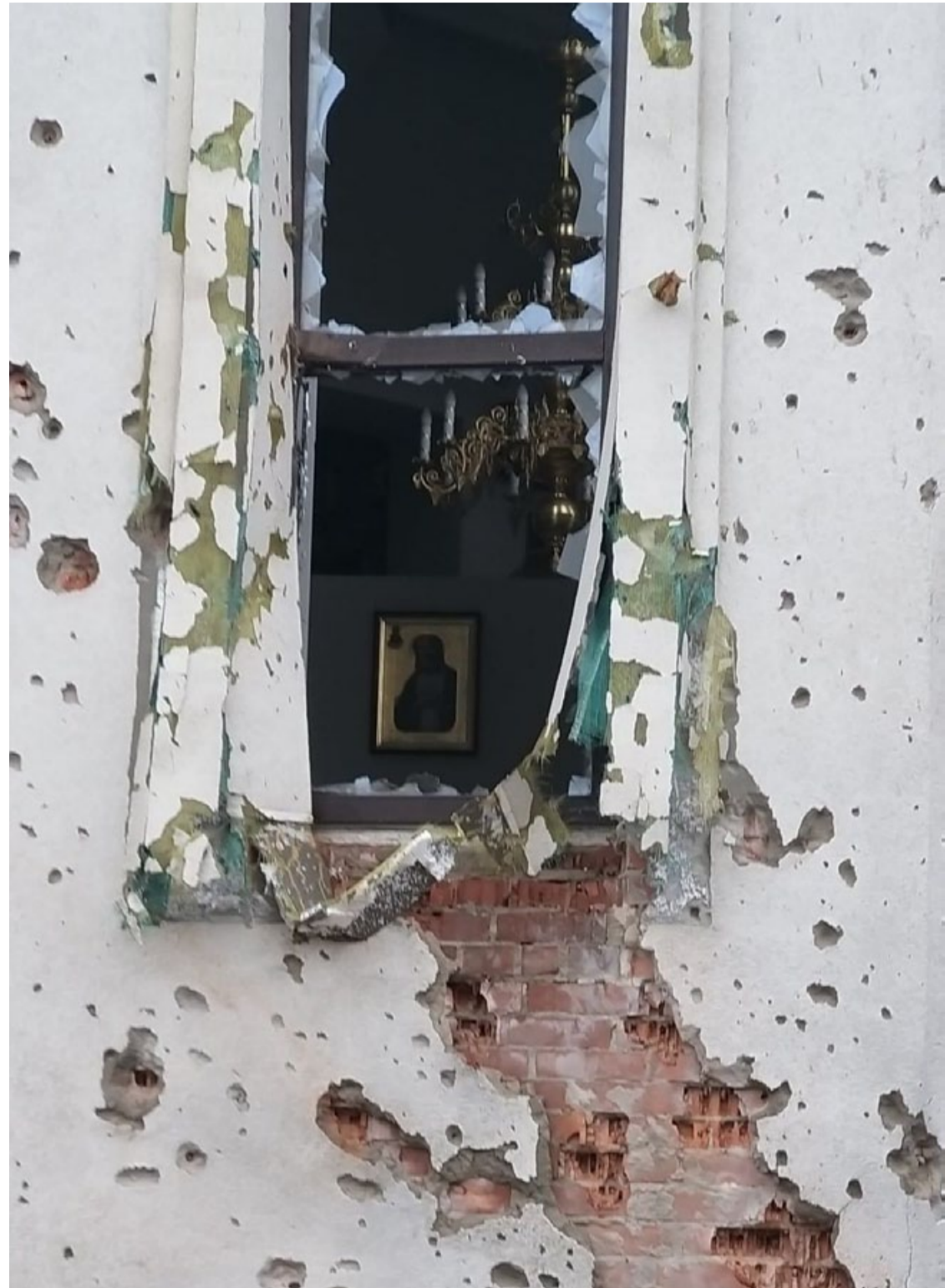
▲ «Русській мір» на околиці Києва, 01.04.2022 р.

У цей страшний час війни надзусилля наших захисників, волонтерів та всіх людей, які в різноманітний спосіб працюють для нашої перемоги, є нічим іншим, як найціннішим внеском у збереження цього Божого світу, збереження людства, людяності, правди, нормальності, добра. Усі ці жертви сотень і тисяч чоловіків і жінок – це також намагання (часто навіть неусвідомлено) відповісти на заклик