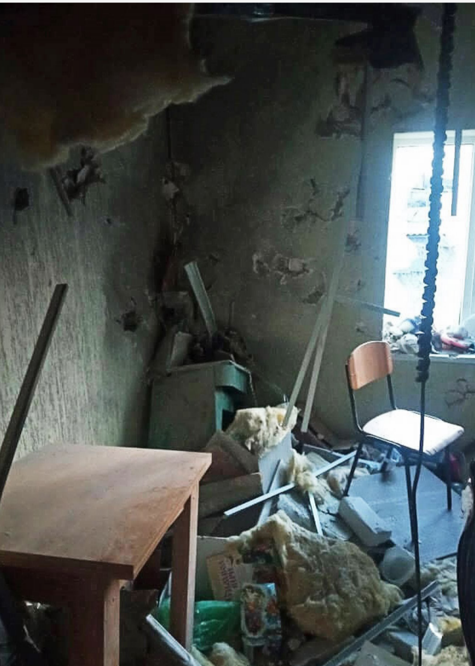
Розбита кімната в дитячому центрі при церкві

Але найбільше я переживала, що там із нашою церквою. Може, тому, що збудувати її нам коштувало багатьох зусиль, ми постійно відчували спротив. Сестра розповідала, як, проїжджаючи повз церкву, побачила, що будівля стоїть, лише де-не-де пошкоджена осколками. Ми з отцем Сергієм пильно передивлялися всі відео, які знімало російське пропагандистське телебачення про роздавання гуманітарки місцевому населенню: а раптом у кадр потрапить наша церква? А ще хотіли зрозуміти, який стан будівлі всередині.