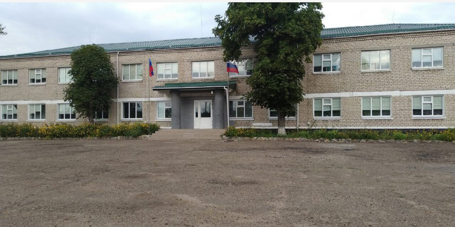
Муратівська гімназія в окупації з ворожими прапорами Росії та її маріонеткової «республіки»