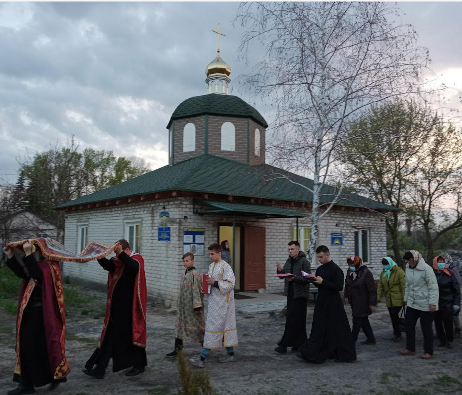
2021 рік. Великодні Святкування. Наша святиня – храм Святого Миколая в с. Муратове