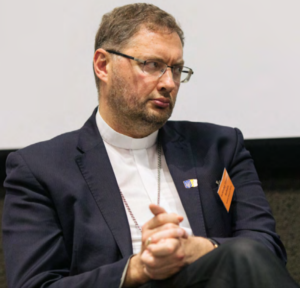
Архиепископ Вісвальдас Кульбокас

У відповідь науковець з Нотр-Даму повторив свою тезу, що релігія все ж має стосунок до цієї війни, оскільки історичні наративи, які використовує путінський режим для виправдання свого імперіалізму, мають також релігійний аспект: «Інтерпретація історії Росією є імперською інтерпретацією, але частиною того, що інтерпретується є церковна історія». Тому він вважає, що можна було б сказати, що справжня релігія не має стосунку до цієї війни, але ми не можемо уникнути дискусії про роль релігії у цій війні, оскільки російська влада використовує у своїй імперській пропаганді і Церкву, і церковну історію.