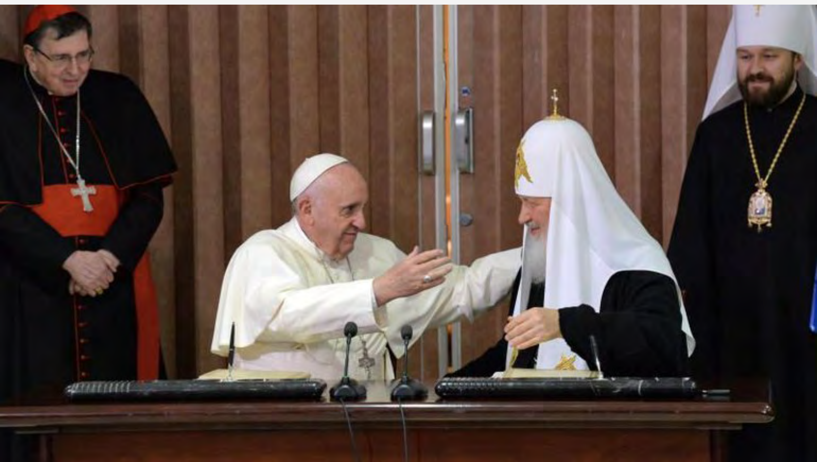
Зустріч у Гавані

Після анексії Росією Кримського півострова і початку проксі-агресії на Донбасі в лютому 2014 року Апостольський Престол намагався відігравати посередницьку роль у пошуках мирного розв'язання конфлікту. І українське керівництво якийсь час розглядало Ватикан як можливий і бажаний майданчик для перемовин, не зважаючи на досить стриману оцінку окремих висловлювань та ініціатив Папи. Повномасштабне вторгнення російських військ в Україну у 2022 році зруйнувало надії на можливість припинення війни шляхом перемовин. Це, однак, не знеохотило релігійних лідерів від продовження дипломатичних зусиль, щоб зупинити кровопролиття.