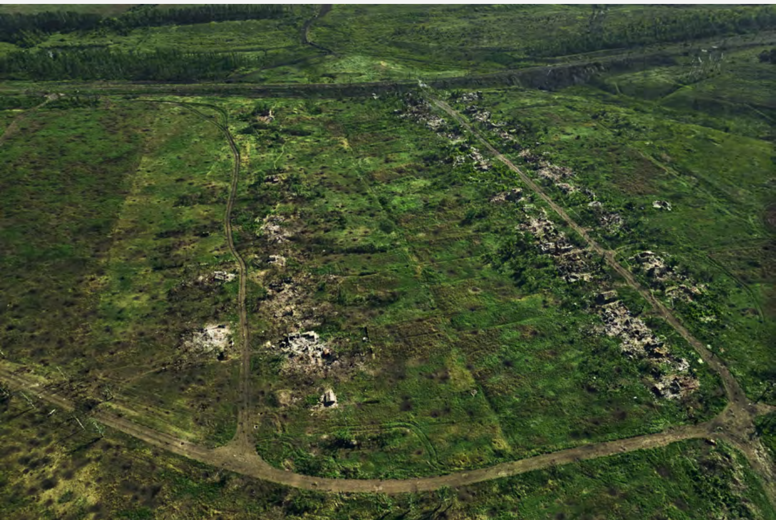
Обличчя російсько-української війни, 03.09.2023 р. Вид на зруйноване село Опитне біля Бахмута в Донецькій області.