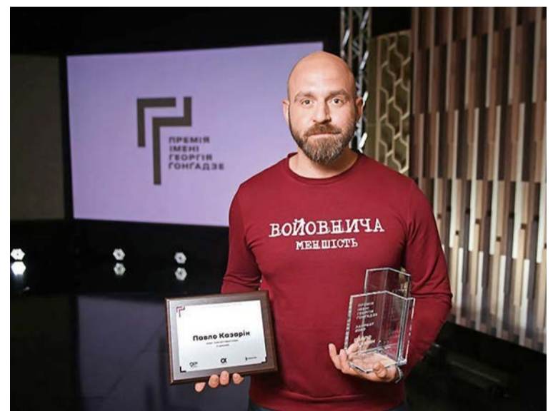
▲ Павло Казарін з нагородою

Георгій Гонгадзе – опозиційний журналіст, засновник та перший головний редактор інтернет-видання «Українська правда». Він