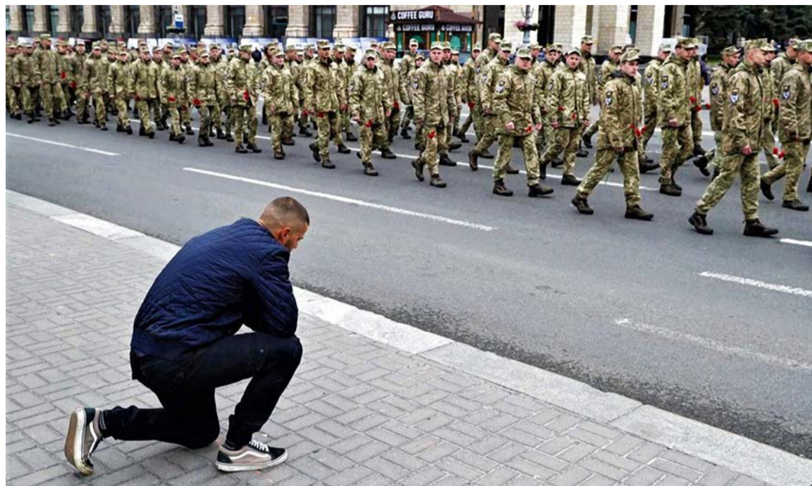
▲ День пам'яті та примирення в Києві, 08.05.2019 р.

Так апокаліптичне зло набуло вигляду рятівного добра. Й усміхнений uncle Джо – дядько Йосип зі своєю незмінною люлькою став