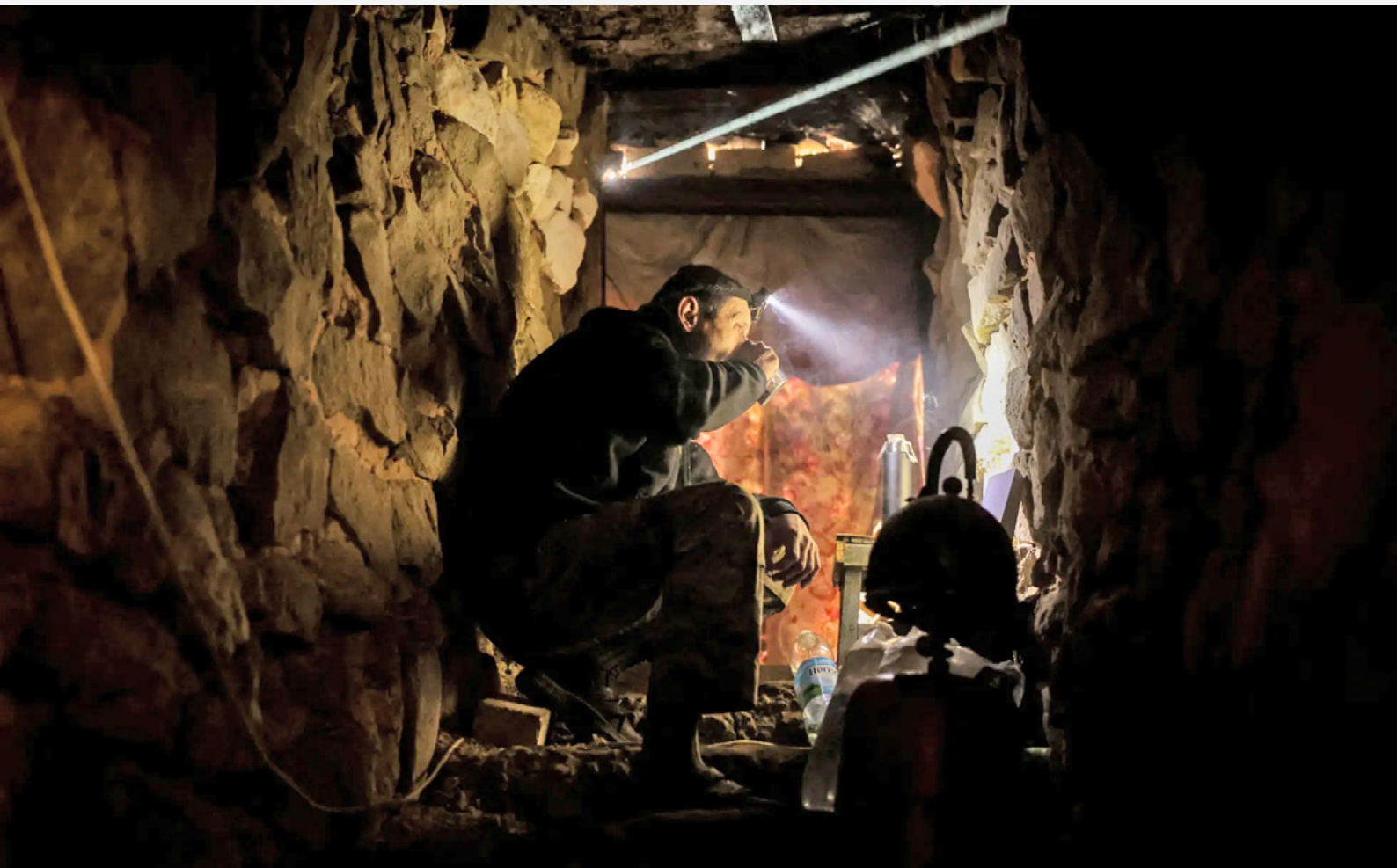
«Обличчя російсько-української війни», 20.11.2024 року. Український воїн в окопі на лінії фронту біля Часового Яру.

За тією ж логікою не буде великим перебільшенням припустити, що у нас за вікном триває довгий 2014-й – сказати б, «Майдан довгого тривання». Адже наслідки Революції гідності, наче кола на воді, ось уже одинадцятий рік продовжують розходитися навсібіч.