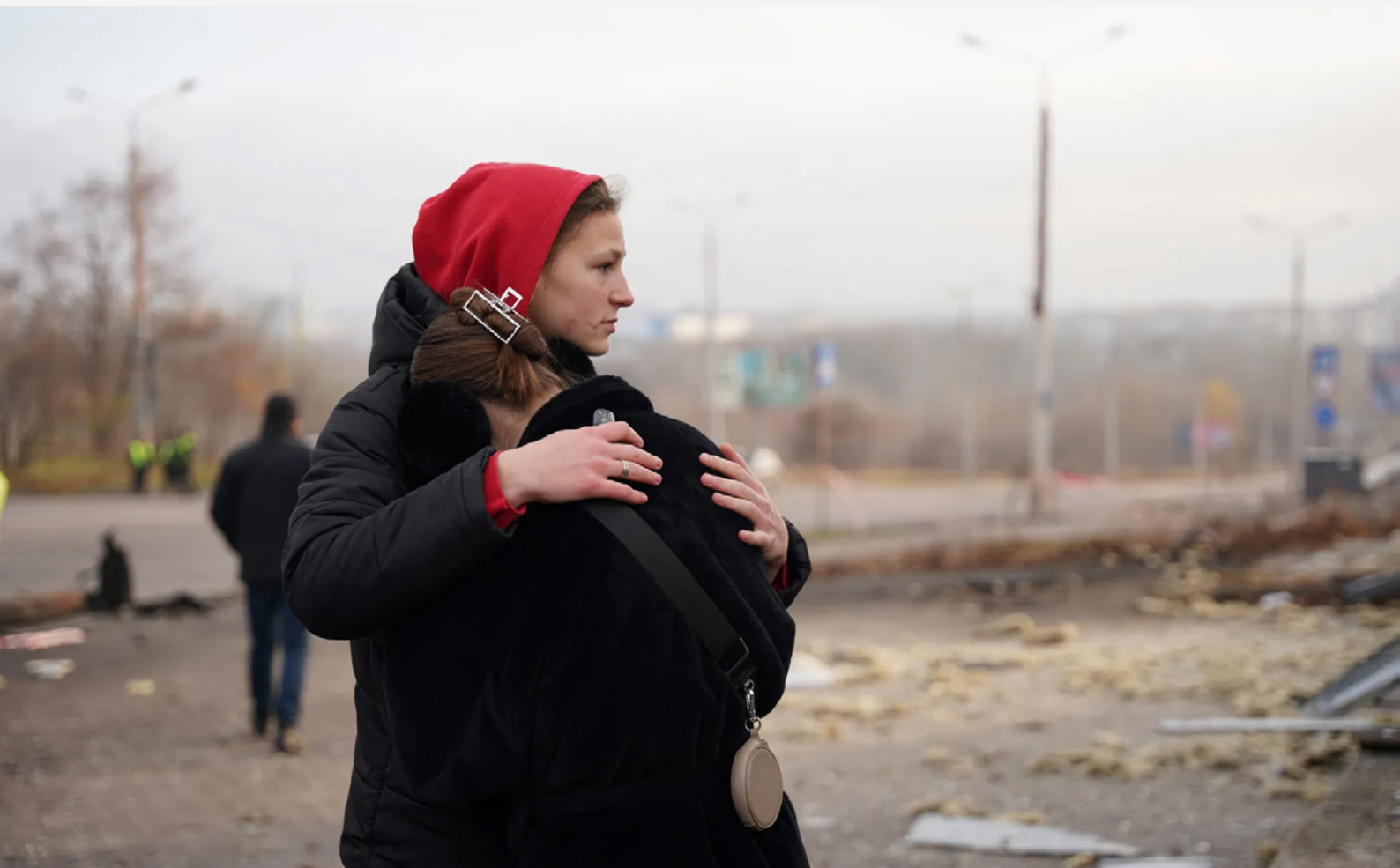
«Обличчя російсько-української війни», 22.11.2024 року. Мешканки Сум на місці удару російського безпілотною по житловому району міста.

Скориставшись запрошенням представити півострів під час голосування аудиторії в студії «Шустер LIVE» як безцінною для вчорашнього студента нагодою дістатися Києва за рахунок організаторів, я зателефонував другові з Кримської сотні самооборони Майдану, щойно ступив на перон у Дарниці. Він попросив не баритися.