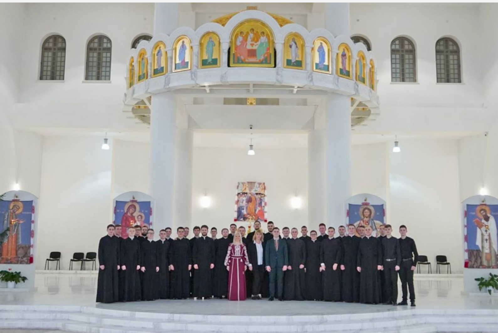
Семінаристи КТДС та КПБА у Патріаршому соборі Воскресіння Христового

Унікальність і знаковість виконання колядки полягає у співпраці студентів двох різних конфесій – Української Греко-Католицької Церкви та Православної Церкви України. Ця подія показала, що, попри розбіжності у традиціях, християни можуть єдиним голосом свідчити про свою віру в Христа та працювати разом на благо українського суспільства.