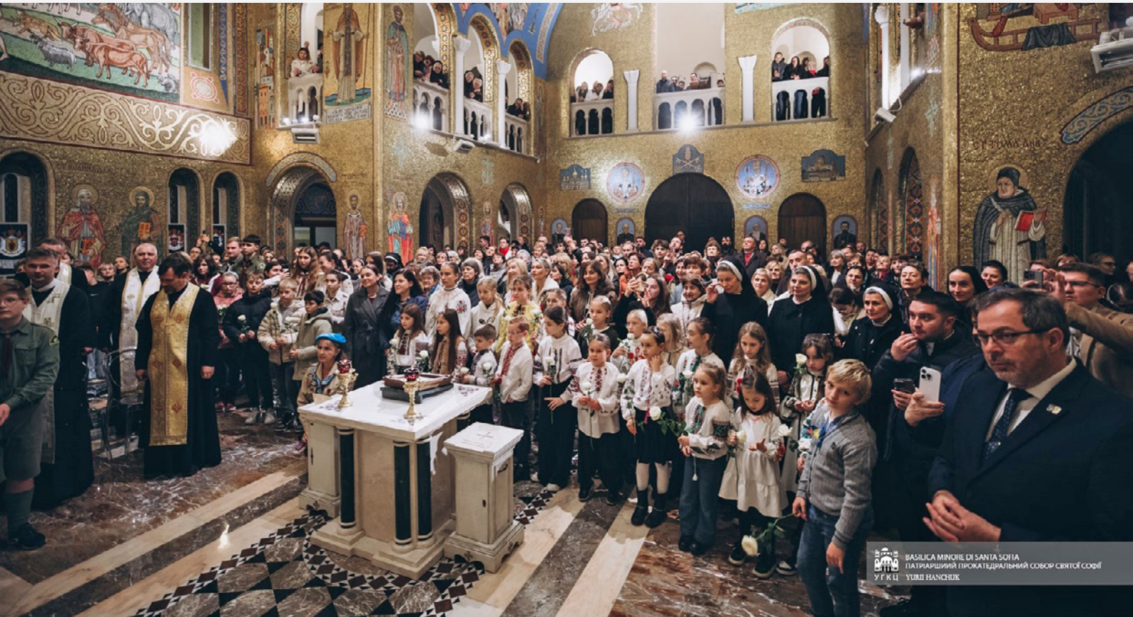
БАЗИЛИКА МІНОРЕ ДІ САНТА СОФІА ПАТІАРІАРШИЙ ПРІКАТЕДРАЛЬНИЙ СОБОР СВЯТОЇ СОФІЇ УГКЦ ЮРИЙ НАНСЬК

Відтак він наголосив, що «ці слова актуальні й сьогодні, де ворог намагається знищити нашу християнську, духовну, культурну та національну ідентичність».