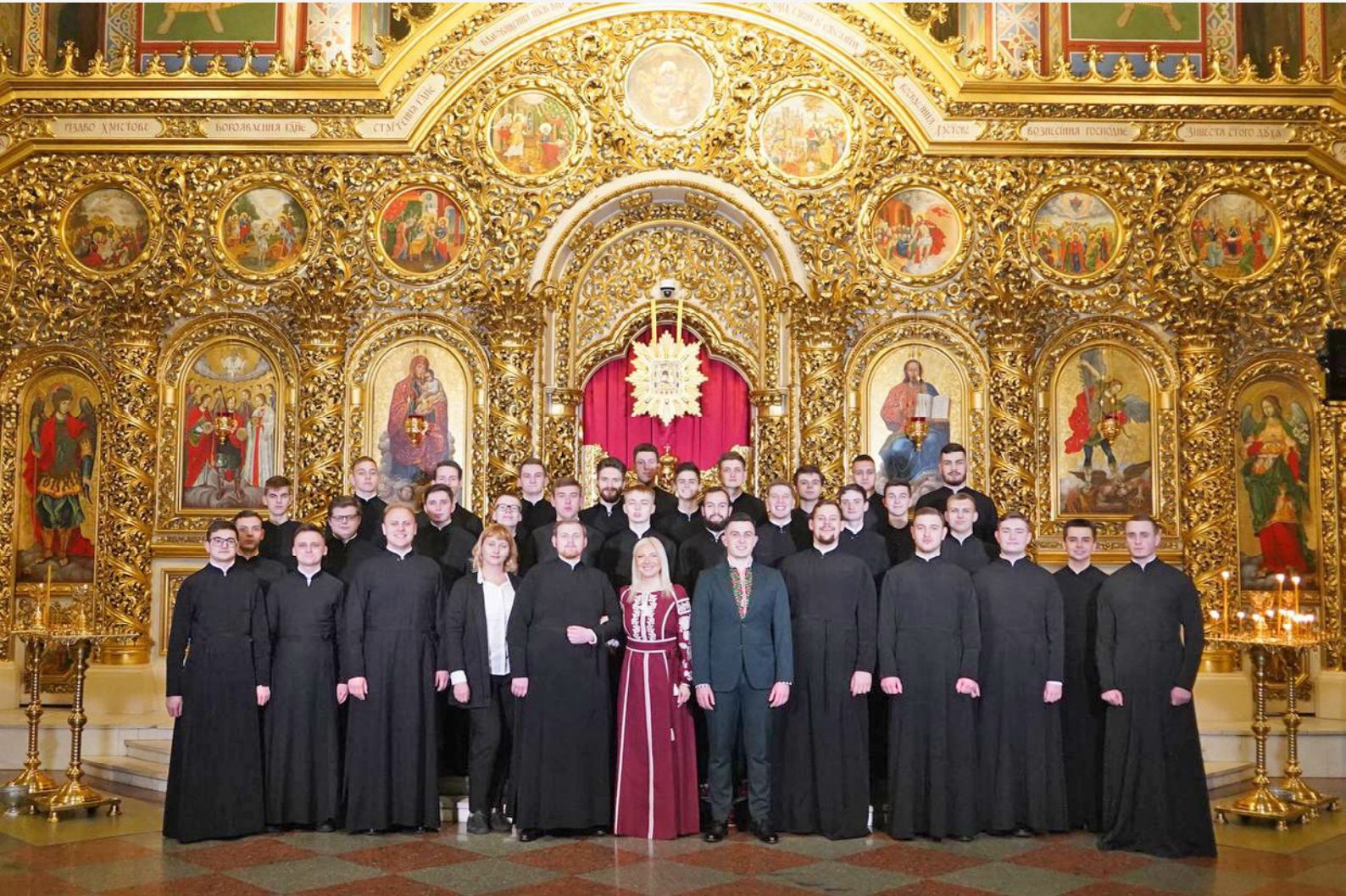
Семінаристи КТДС та КПБА у Михайлівському Золотоверхому соборі