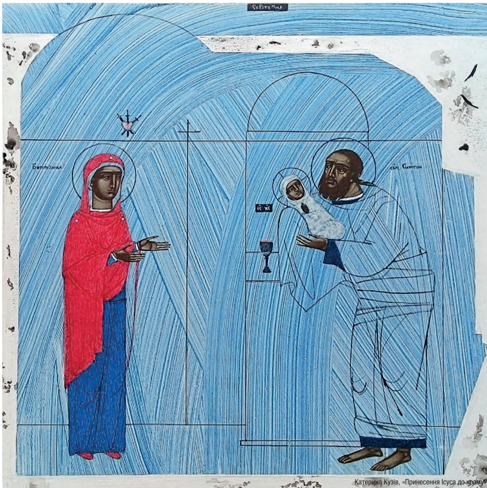
Катерина Кузів, «Принесення Ісуса до храму»

В свято Богоявлення, коли 30-літній Ісус прибув на Йордан до Івана, відбулась зустріч Бога і людини. Але перша зустріч Бога з людиною відбулась, коли Син Божий ще був малесенькою дитинкою, яка вміла тільки плакати – це сталося на 40 день від народження. Праведному Симеону і пророчиці Анні, які були дуже похилого віку, було відкрито св. Духом, що дитинка, яку принесли в Єрусалимський храм для посвячення Богові, є той Спаситель, якого вони чекали і про якого говорили пророки.