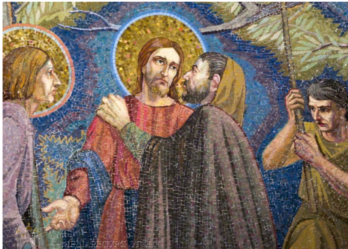
▲ Мозаїка «Зрада Юди», Базилика Агонії Господньої в Єрусалимі

Про це сказав Отець і Глава Української Греко-Католицької Церкви Блаженніший Святослав у своєму воєнному зверненні у 56-й день війни. Таких зрадників Глава Церкви порівняв із Юдою Іскаріотським, який зрадив Ісуса Христа за гріш. «А Україна – наша Мати, – наголошує Предстоятель. — Наш народ, який виборює своє право на життя, є тим, кого не можна оцінити. Йому не можна виставити ціну, бо людське життя є безцінне в Божих очах», – зауважив Глава Церкви.