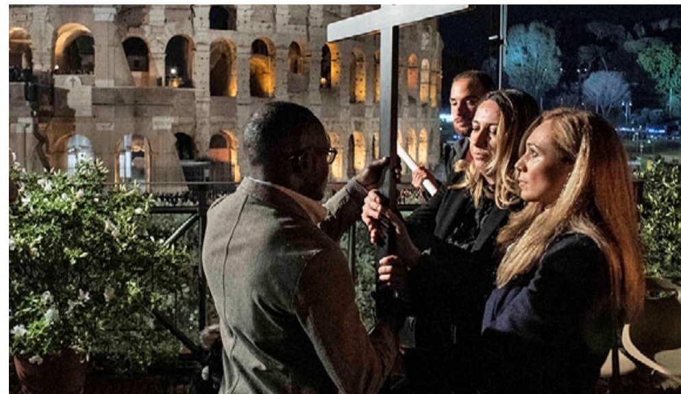
▲ Рим, 15.04.2022 р. Українка та росіянка на Хресній дорозі.