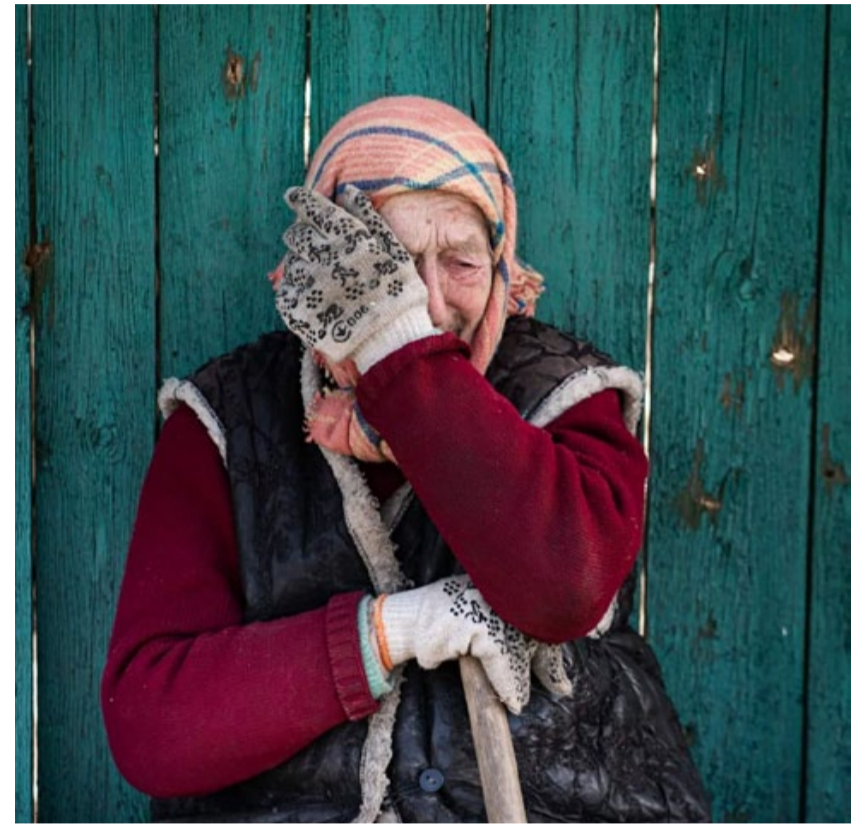
▲ 04.2022 р. Андріївка, Бородянський р-н. «Стільки болю у цій фотографії... Адже ця бабуся переживає вже другу війну». Текст: Іванна Приходько

Як повідомлялося, 24 лютого президент рф володимир путін оголосив про початок повномасштабного вторгнення в Україну. Війська рф обстрілюють і руйнують ключові об'єкти інфраструктури, проводять масовані обстріли житлових районів українських міст і сіл з використанням артилерії, реактивних систем залпового вогню, балістичних ракет, авіабомб. Загарбники влаштували масовий терор на тимчасово окупованих територіях.