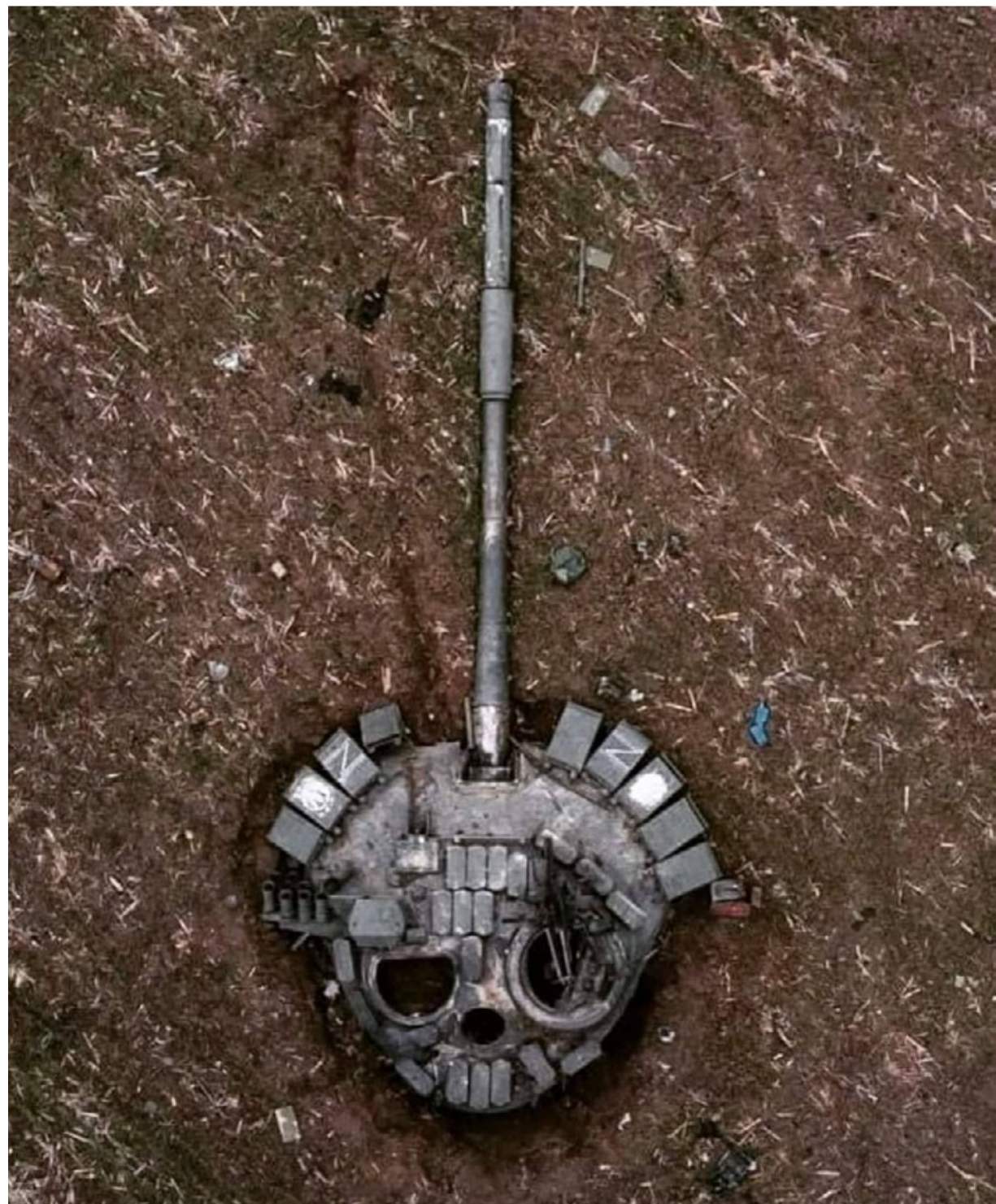
Російський танк Т-72Б3 на українській землі, фрагмент