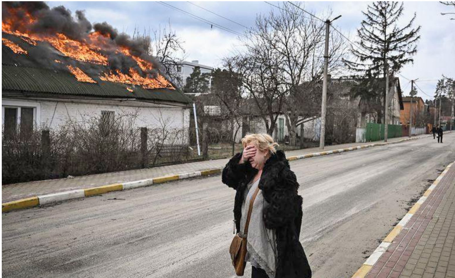
▲ Жінка сумує перед палаючим будинком після обстрілу м. Ірпінь, що на околиці Києва, 04.03.2022 р.

«Цією домовленістю сторони надсилають чіткий сигнал, що докладуть усіх зусиль, щоб зібрати свідчення із основоположних міжнародних злочинів, скоєних в Україні та притягнення винних до правосуддя», – йдеться в заяві Eurojust.