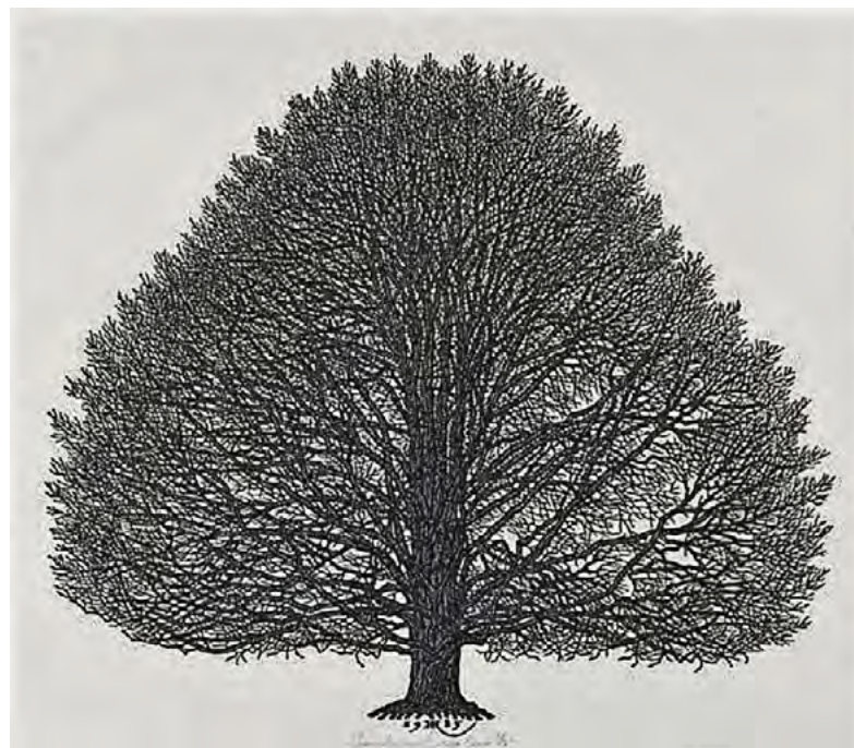
Яків Гніздовський (1915–1985), «Бук мідний»

«Слід визнати, що героями фанатизму, який веде до нищення інших, є також релігійні особи, не виключаючи також і християн», – додає Папа, зауваживши,