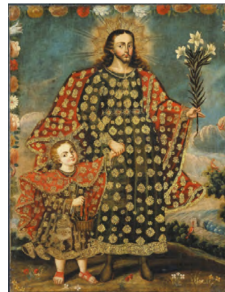
Святий Йосиф з дитиною-Христом. Живопис школи Куско, Перу. З Вікіпедії.

У світлі того, що Слуга Божий Пій XII встановив 1 травня 1955 року свято святого Йосифа Ремісника, аби сприяти визнанню гідності праці, «повний відпуст