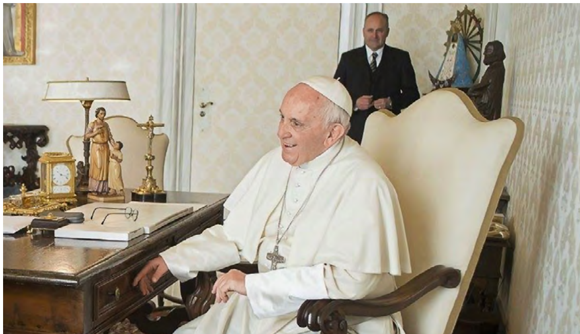
Статуя святого Йосифа на робочому столі Папи Франциска.

У своєму Апостольському листі « Patris corde – Із серцем Батька », Папа Франциск спогадує 150-річчя проголошення святого Йосифа Обручника покровителем вселенської Церкви. З цієї нагоди від 8 грудня цього року до 8 грудня 2021 відзначатиметься «Рік святого Йосифа».