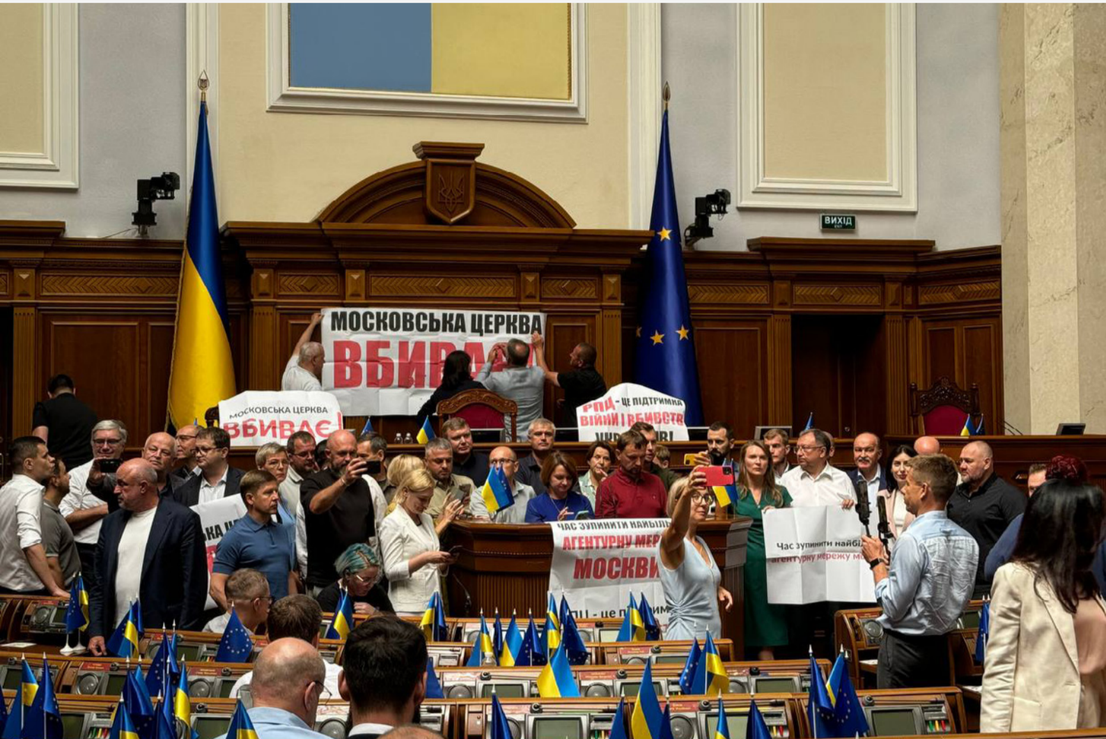
Депутати блокують трибуну Верховної Ради, 23 липня 2024 року

20 серпня Верховна рада України ухвалила в цілому законопроект про захист релігії від милітаризації, яким можуть унеможливити діяльність УПЦ МП. Історичне рішення підтримало 265 депутатів. Закон набирає чинності через 30 днів з дня його опублікування.