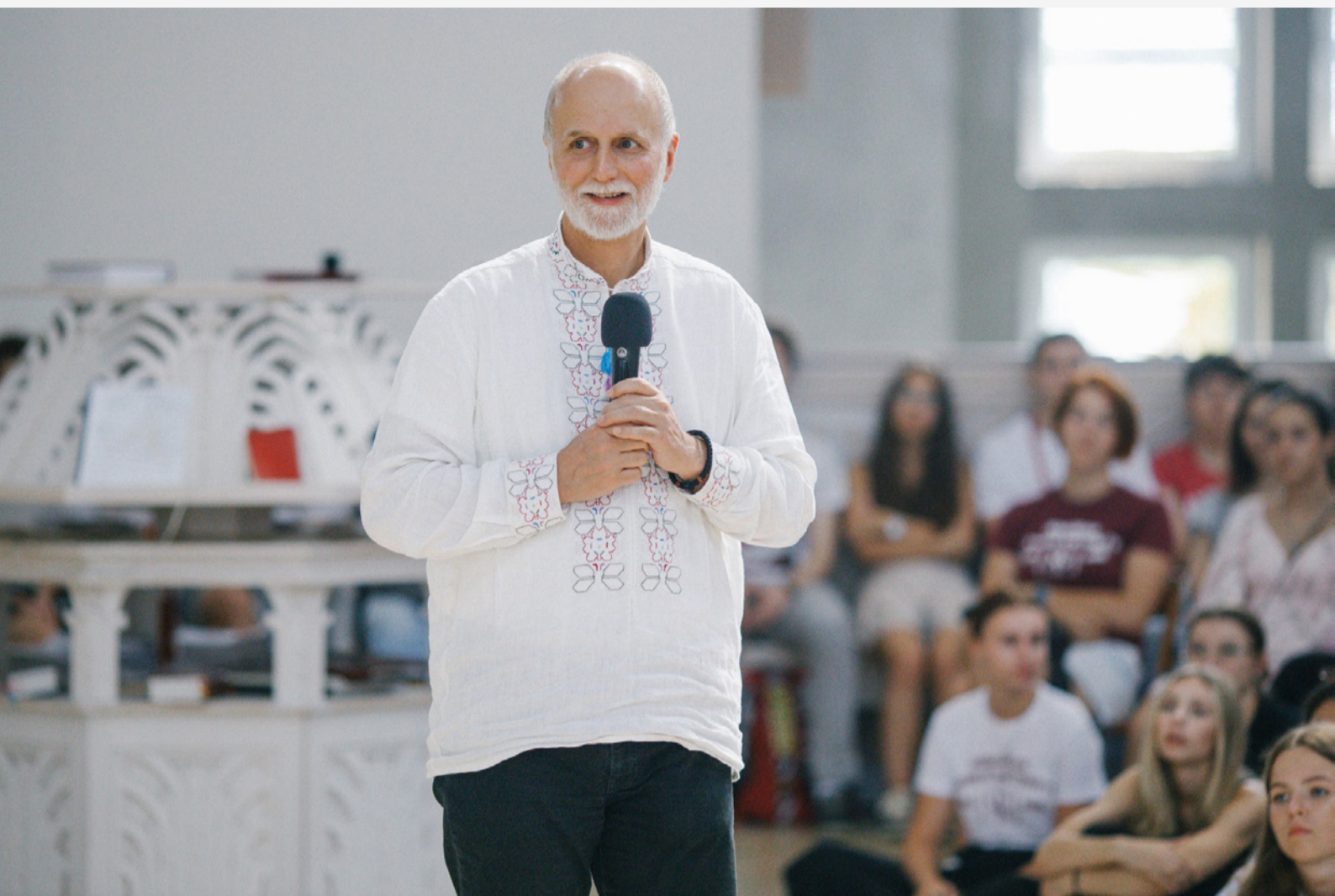
Президент УКУ, митрополит Філадельфійський Борис Ґудзяк