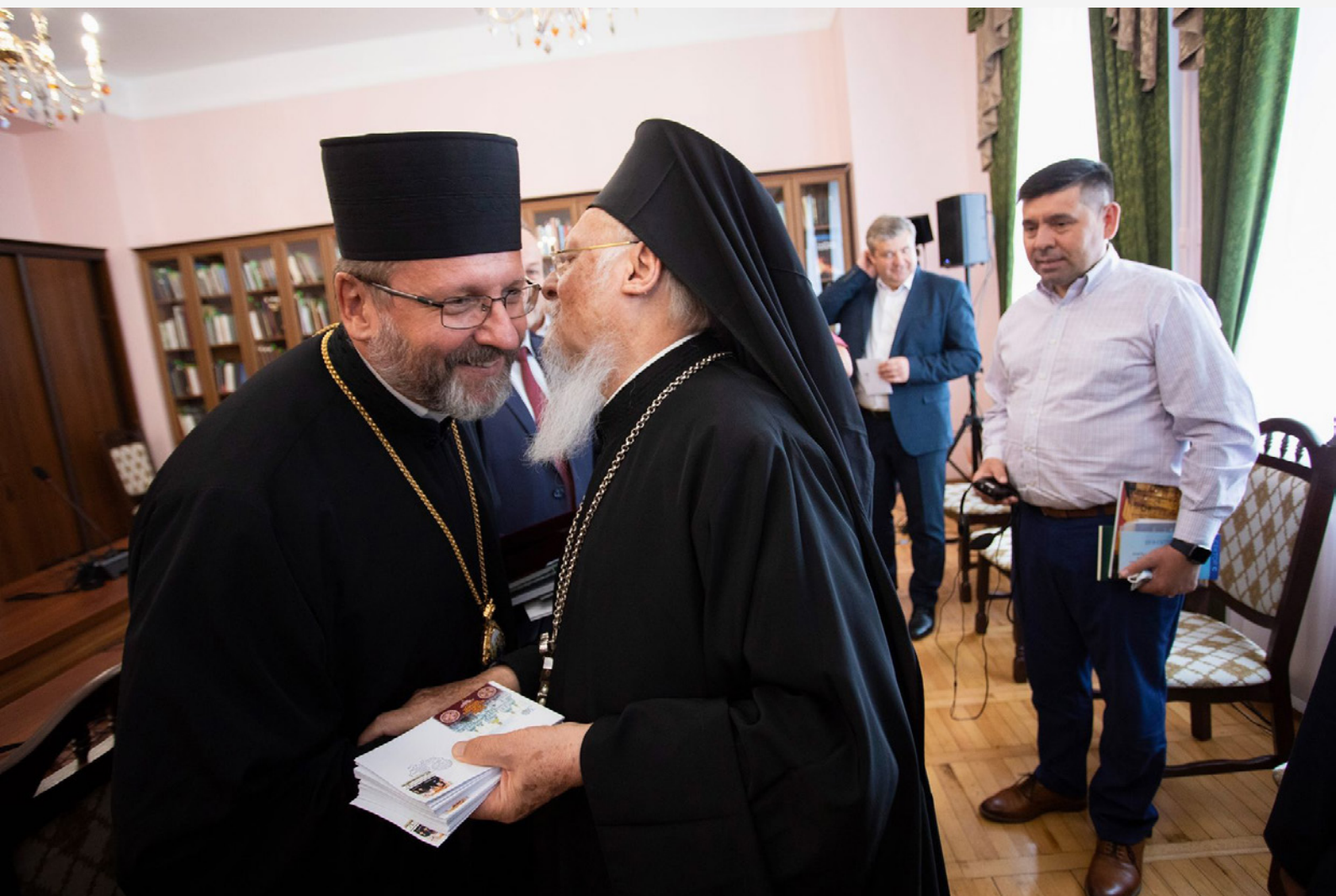
Зустріч Блаженнішого Святослава з Патріархом Варфоломієм у Києві, 23.08.2021 року

Бачимо, що одним із вимірів лікування ран є міжцерковний, зокрема екуменічний, діалог. Про це сказав Отець і Глава Української Греко-Католицької Церкви Блаженніший Святослав у своєму традиційному відеозверненні у 129-й тиждень повномасштабної війни, великого протистояння на всій лінії фронту, який приніс багато кривавих втрат.