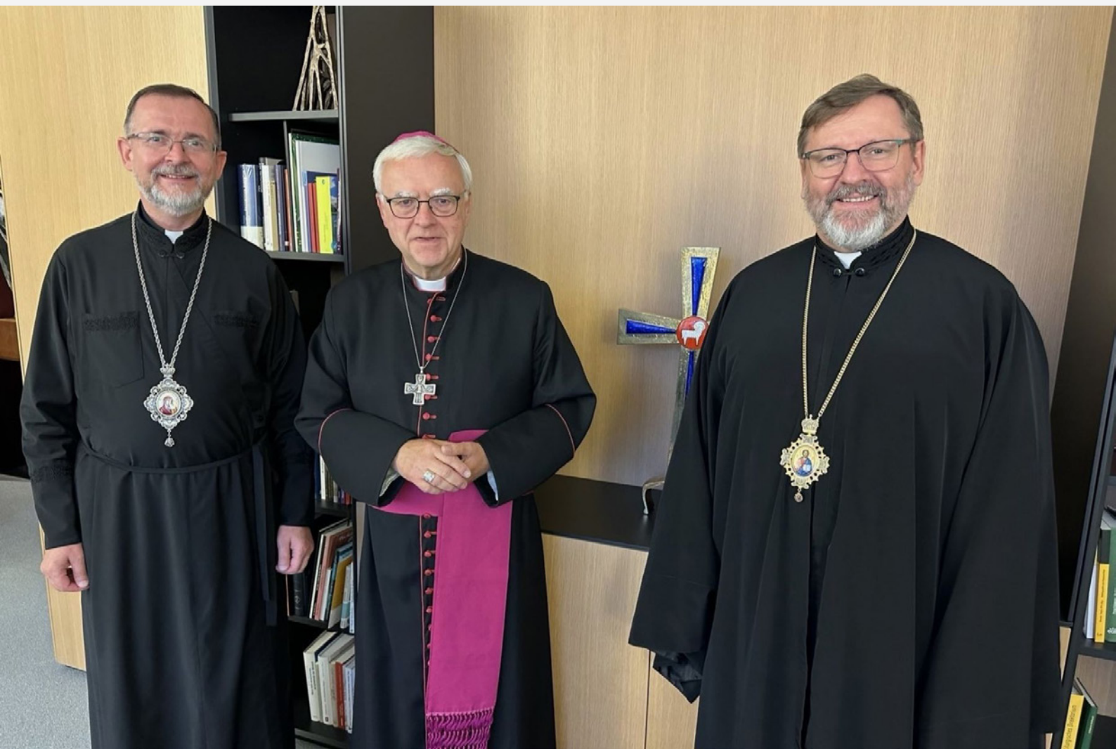
Владика Богдан Дзюрах, архієпископ Гайнер Кох та Блаженніший Святослав

9 вересня 2024 року в Берліні Отець і Глава Української Греко-Католицької Церкви Блаженніший Святослав зустрівся з архієпископом Берліна Гайнером Кохом. У зустрічі також взяв участь владика Богдан Дзюрах, апостольський екзарх у Німеччині та Скандинавії.