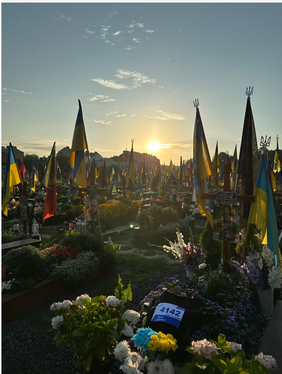
Марсове поле у Львові