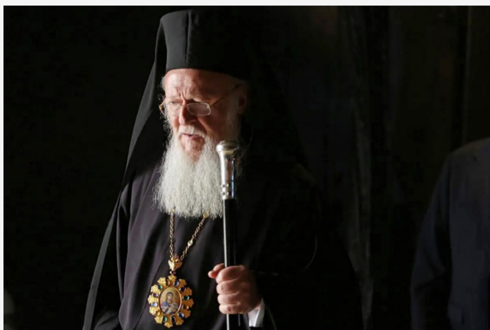
Вселенський Патріарх Варфоломій у Центрі пам'яті жертв Голокосту «Яд Вашем»

Патріарх наголосив, що, незважаючи на різні голоси критиків, які звинувачують Папу Франциска в недостатній рішучості у засудженні дій росії, Константинопольський Патріархат високо цінує його пастирську турботу про страждальний український народ. Відтак відзначив особисту участь Папи в поверненні викрадених українських дітей та залучення Ватикану до Саміту миру. А ще нагадав, що «Папа також гостро висловився у своєму зверненні до московського патріарха кирила, називаючи його "вівтарником президента путіна"» .