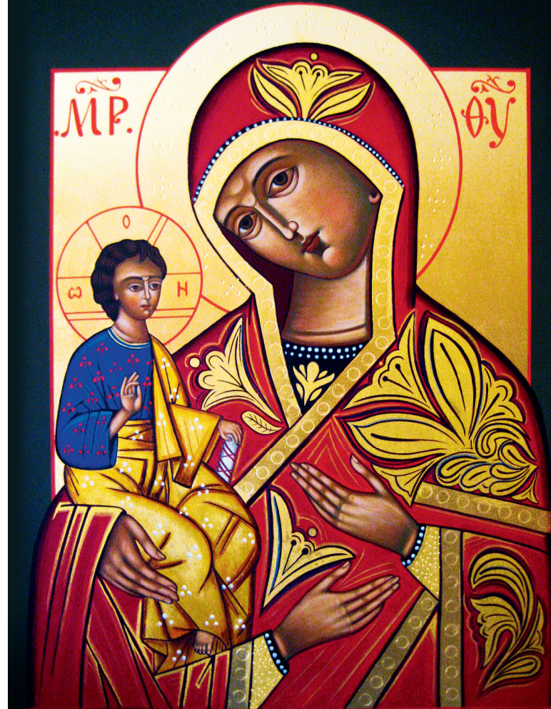
Gottesmutter mit den drei Händen

Bildnachweis: Ikone der Gottesmutter mit den drei Händen, Tricherosa, gemalt von Alfred Rebhan aus Teuschnitz nach einer Ikone von Dr. Peter Dyckhoff, aus Griechenland, 18. Jhdt. Bezugsadresse: Heilig-Blut-Gemeinschaft vom Erlöser der Welt e.V., Sr. Michaela-Josefa Hutt, Bühl 1, 87480 Weitnau