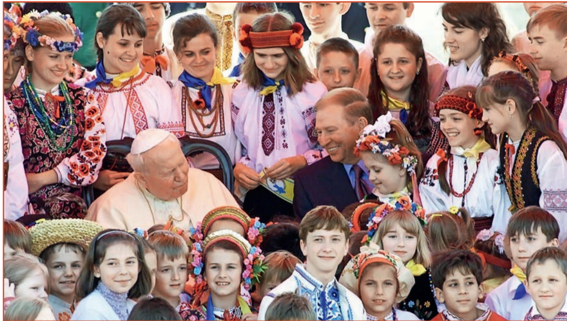
Папа Римський Іван Павло ІІ і тодішній президент України Леонід Кучма разом із дітьми, які зустріли главу РКЦ на летовищі. Київ, 23 червня 2001 р.

лося передбачення о. Піо щодо крові на понтифікаті: турок Алі Агджа здійснив замах на Святішого. Після операції Іван Павло ІІ заявив, що прощає своєму кривднику і молиться за нього.