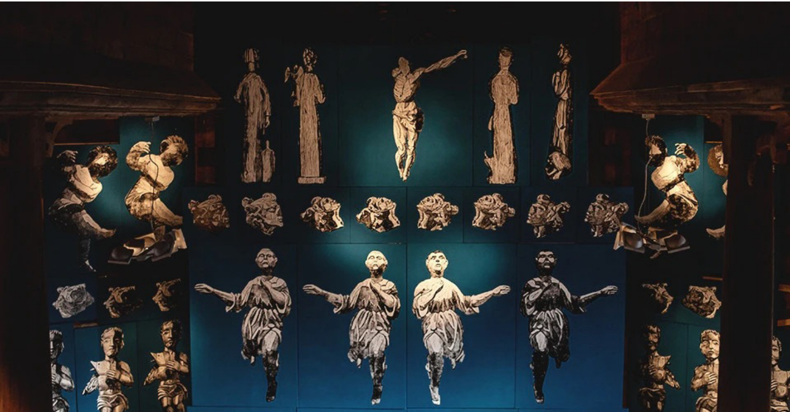
Виставка «Вітвар небесного воїнства»