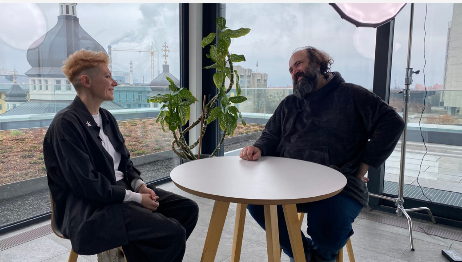
Запис інтерв'ю для проєкту «Малі історії Великої війни»