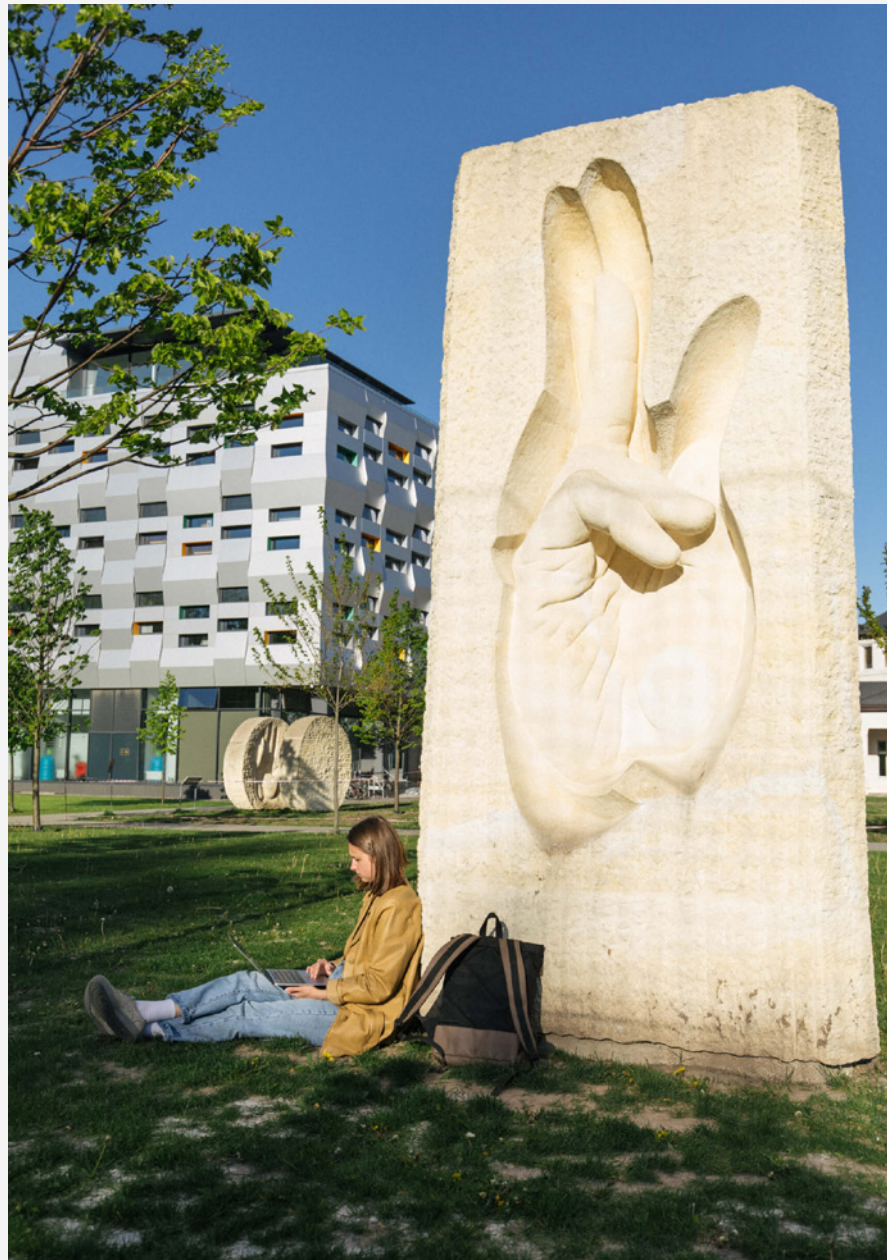
Скульптура «Благословив»

Президент УКУ закликав усіх частіше приходити до каменів, щоб усвідомлювати своє перетворення і шукати відповіді на складні питання: «Коли ми сумніваємося, ким ми є, то наші спокуси стають складнішими, наша стійкість проявляє тріщини. А коли розуміємо, що ми є прийняті та освячені Богом, то можемо свідчити, вистояти, здолати все. Бог хоче, щоб ми стояли рівно і без страху дивилися вперед».