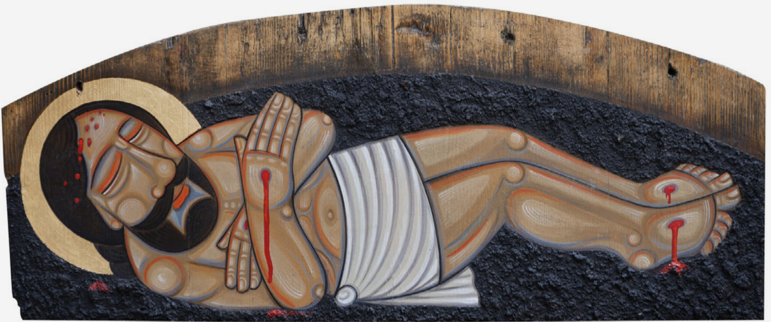
Страсті Христові (з проєкту Романа Зілінка)

Коли над нами всіма нависла війна, я хотів малювати Страсті Христові, бо іншого не можна було малювати в той час. Але ці роботи вирішив поставити на землю, тобто приземлити, зробити ближчими до кожного. І зрештою, на фоні всіх тих численних смертей, втрат, загроз, наша земля стає ще ціннішою.