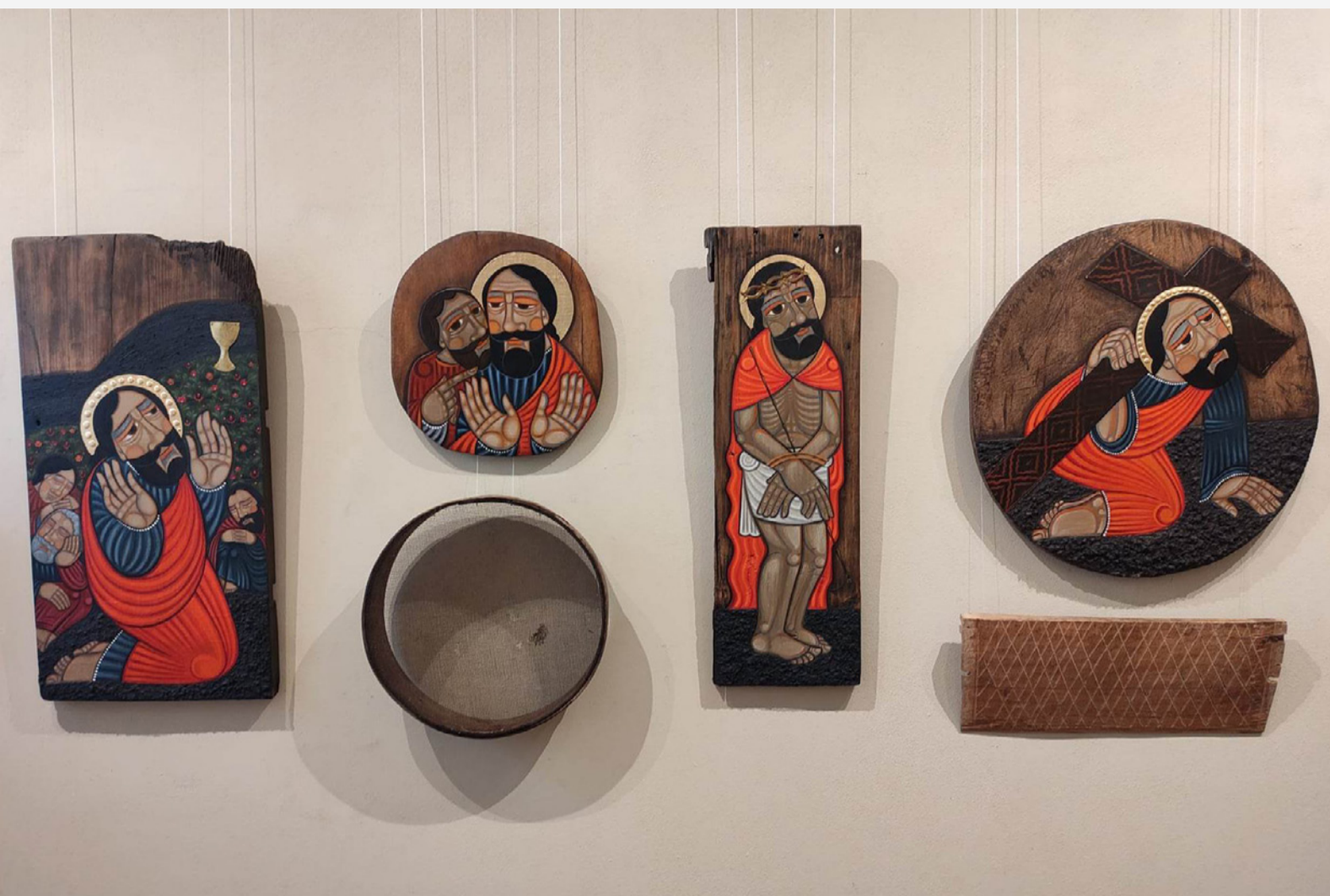
Страсті Христові (з проєкту Романа Зілінка)