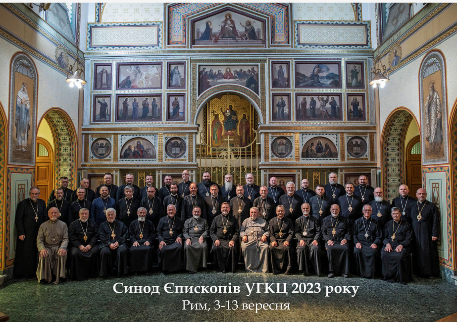
Синод Єпископів УГКЦ 2023 року Рим, 3-13 вересня

На Синоді Єпископів УГКЦ 2023 року владики прийняли із внесеними поправками та доповненнями Місяцеслов УГКЦ. До переліку осіб, яких літургійно вшановують в УГКЦ, увійшли імена 9-ти святих Католицької Церкви. Синод також вніс зміни у святкування свят Пресвятої Євхаристії, Христа Чоловіколюбця і Всіх святих українського народу.