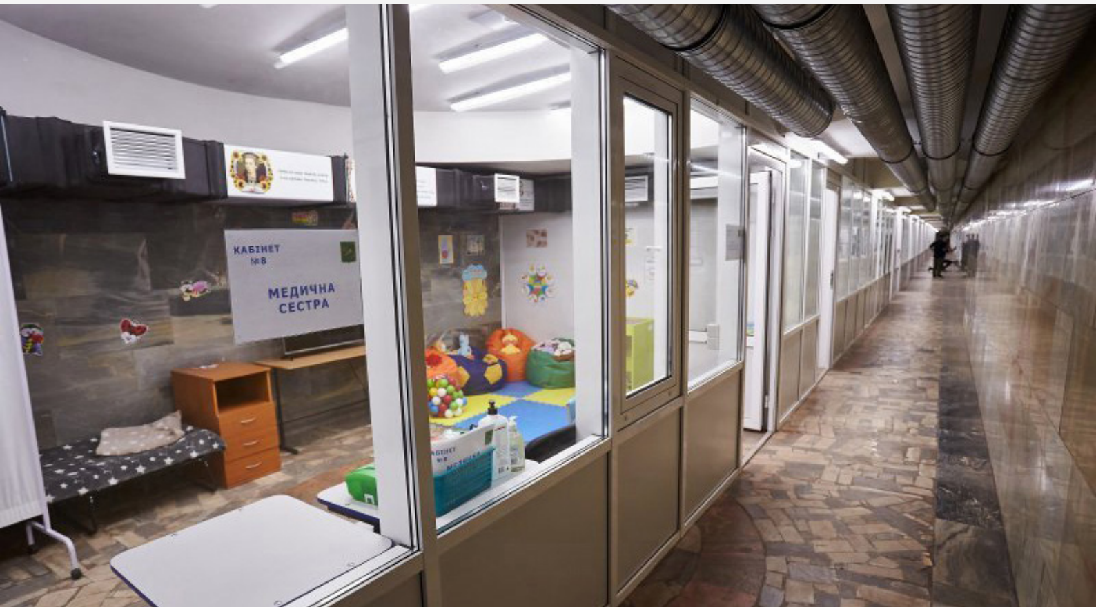
Навчальні приміщення в переходах харківського метро.