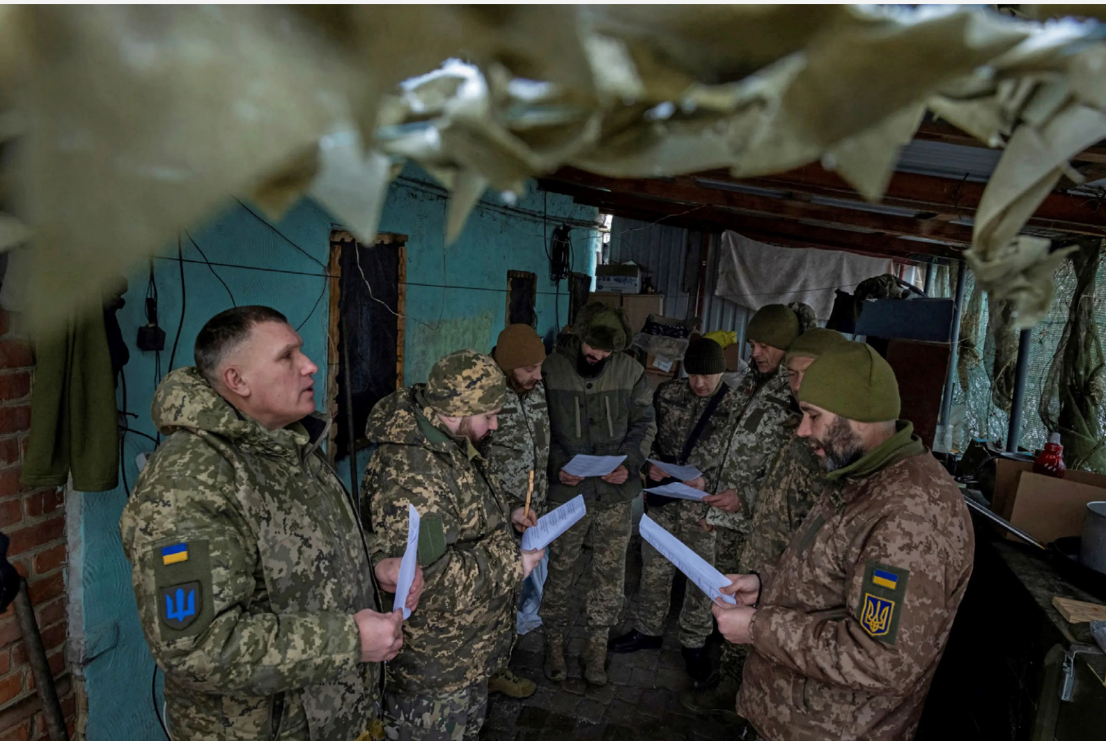
«Обличчя російсько-української війни», 25.12.2023 р. Воїни 93-ї окремої механізованої бригади ЗСУ під час різдвяної Служби Божої на передовій у Донецькій області.

Тому питання не в тому, чи чуємося ми, українці, самотніми, а в тому, яке майбутнє чекає на Європу, якщо прийняти «мирні плани», що влаштовують путіна.