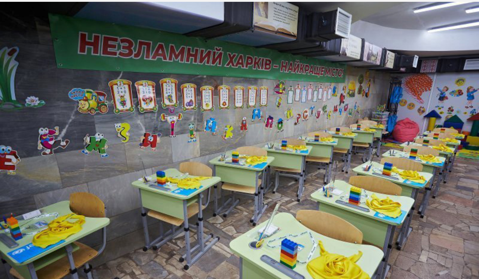
Клас у харківській метрошколі.

До вересня 2023 року в харківському метро облаштували 17 кабінетів площею 40 кв. м кожен із вентиляцією та шумоізоляцією, партами та необхідним обладнанням. Розраховані класи на 20 дітей. Загалом у планах було набрати близько тисячі школярів. Навчальні приміщення обладнані на п'яти станціях метро й працюють як аудиторії, тобто не закріплені за певними класами. Метрополітен тим часом продовжує роботу, кабінети розміщені не на ярусі колій, а між станціями в підземних переходах, які частково перекрили для руху пасажирів.