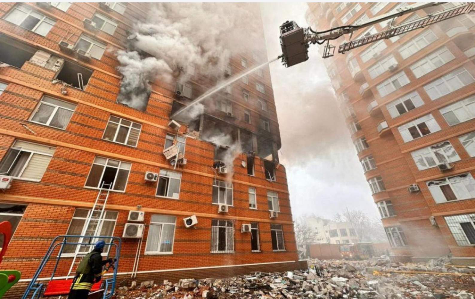
Одеса після російської атаки 29.12.2023 р.

Всеукраїнська рада Церков закликає Всесвітню раду Церков, Конференцію Європейських Церков та інші міжнародні міжконфесійні організації розглянути питання про притягнення до моральної та іншої відповідальності російської православної церкви, яка всіляко підтримує агресію рф проти України , розпалює міжнаціональну і міжконфесійну ворожнечу та через проповідь ідеології «русского міра» спонукає до геноциду українського народу. В контексті зазначеного, нагадуємо приклад діяльності Голландської реформатської церкви в Південно-Африканській Республіці, яка виправдовувала апартеїд, за що була справедливо засуджена міжнародною спільнотою та виключена зі Всесвітньої ради Церков.