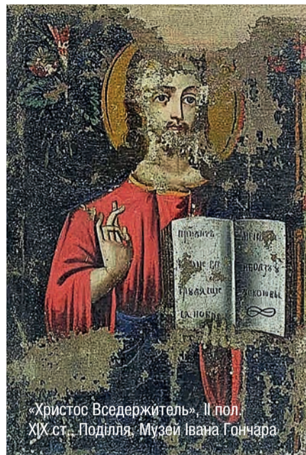
«Христос Вседержитель». II пол. XIX ст., Поділля, Музей Івана Гончара

Христос має бути царем наших душ. Якщо у наших душах є Божя ласка, якщо совість каже нам,