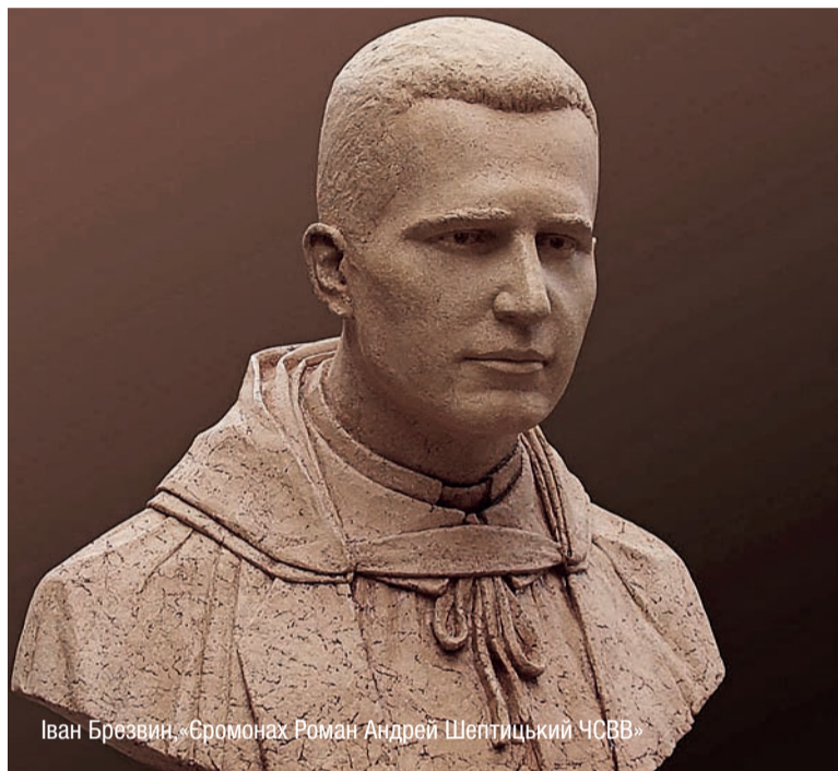
Іван Брезвін. «Бромонах Роман Андрей Шептицький ЧСВВ»