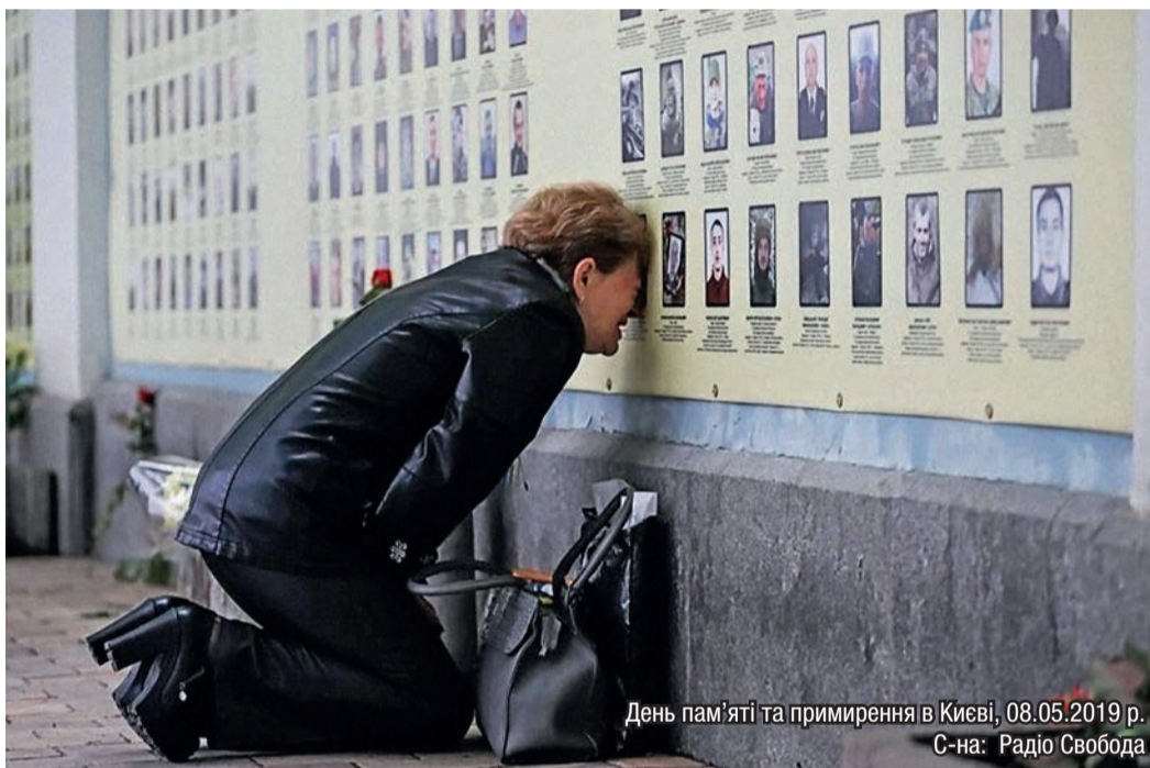
День пам'яті та примирення в Києві, 08.05.2019 р.

Одна черниця написала свідчення: «Я постійно прагнула до досконалості. В ордені, пізнавши харизму та ідеали, включилася в них усім серцем. Працювала понад сили, а по ночах штурмувала молитву. Ставала