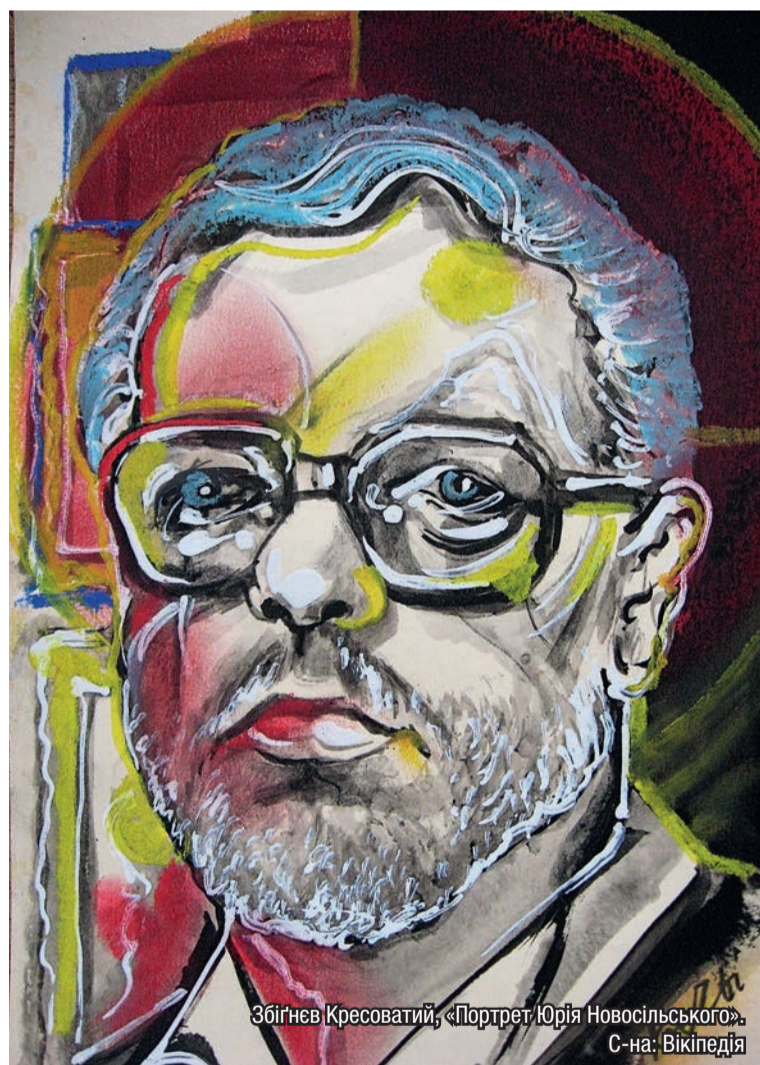
Збігнев Кресоватий, «Портрет Юрія Новосільського». С-на: Вікіпедія

щоби з твоєї відмови хтось інший отримав користь, щоб наситився й помолився за тебе Господеві». Милостиня як вияв любові до ближнього є наслідуванням самого Бога, Який першим виявив Своє милосердя до людини. (787)