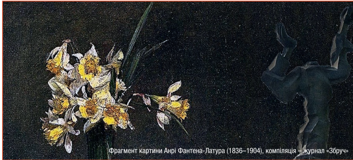
Фрагмент картини Анрі Фантена-Латура (1836–1904)

Тоні Джадт був не лише видатним істориком, він був євреєм, який навесні 1967 року із сіоністичним запалом займався в Англії пошуком волонтерів, а відтак і сам вилетів до Ізраїлю, щоб докластися до перемоги в Шестиденній війні – спочатку роботою в кібуці, а потім і добровільною службою в допоміжних військах. Тому Джадт мав моральне право як завгодно висловлюватися про пізнішу політику Ізраїлю. Мав, однак мені наведені його слова донедавна здавалися відчайдушним перебільшенням. Після бенефісу