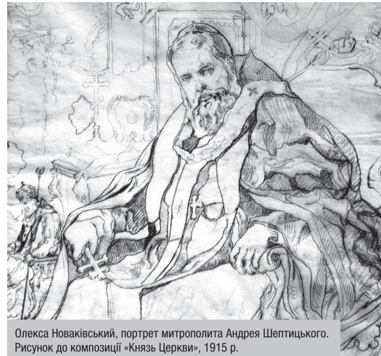
Олекса Новаківський, портрет митрополита Андрея Шептицького. Рисунок до композиції «Князь Церкви», 1915 р.

Не сумніваймось ані на хвилю, що наші молитви будуть вислухані. Дасть Бог Духа Святого нашому народові, і та бідна і дорога Руська земля, яка