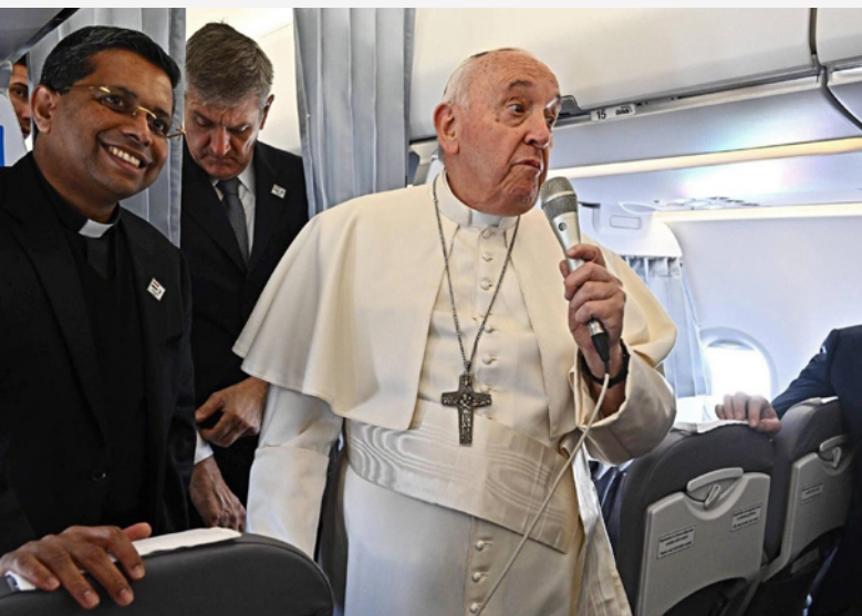
Світлина ілюстративна

На драму сучасного світу, в якому народжується все менше дітей, вказав Папа Римський під час аудієнції для італійського католицького скаутського руху дорослих. Середній вік в Італії становить 46 років, замість дітей жінки возять у колясках своїх песиків, сказав Папа Франциск.