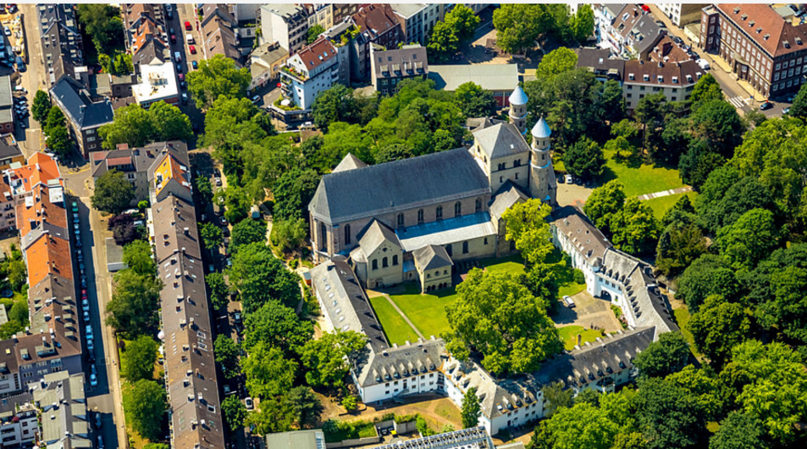
Храм на честь св. Пантелеймона у Кельні, сучасний вигляд

У німецькому місті Кельн, у південній частині старого міста, розташовується величний старовинний католицький храм на честь св. Пантелеймона [нім. St. Pantaleon], при якому у середньовіччі існувало знамените однойменне бенедиктинське абатство. Ця святиня є духовною перлиною міста і центром паломництва та туризму. Але мало хто знає, що цей монастир у Кельні має певне відношення до України-Русі та, зокрема, до київської великокнязівської династії Мстиславичів.