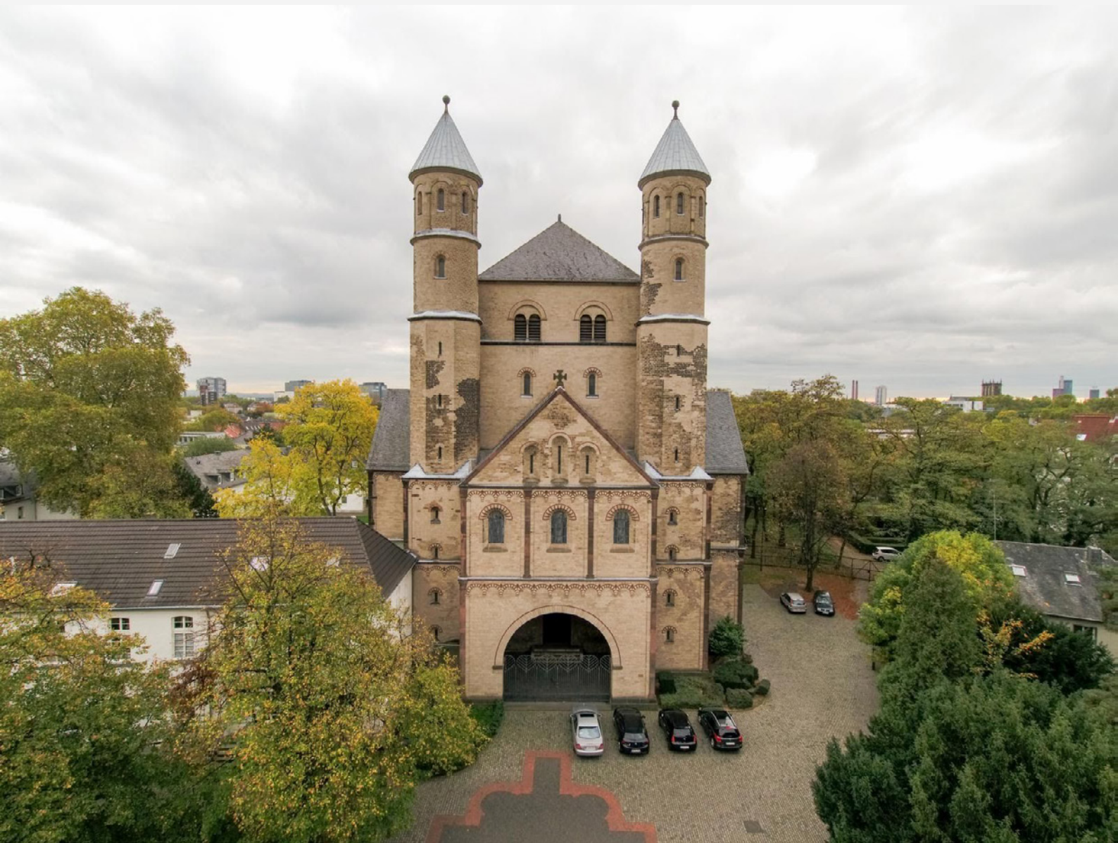
Храм на честь св. Пантелеймона у Кельні, сучасний вигляд | Світлина: www.freundeskreis-pantaleon-koeln.de

Дивовижну історію про зв'язок дружини Володимира Мономаха з Пантелеймонівським монастирем у Кельні переповідає чернець цієї обителі, німецький богослов, а пізніше абат монастиря в Дойц поблизу Кельна о. Руперт (1075–1129), який, судячи з усього, особисто знав кн. Гіту. Його твір, відомий як «Похвальне слово Святому Пантелеймону», був написаний наприк. XI – поч. XII стт. Він дійшов до нас у списку другої пол. XII ст. і нині зберігається в Історичному архіві в Кельні [Historisches Archiv Koeln, cod. Wallraf. 320]. Інший список XII–XIII стт. з рукописної збірки «Liber Bibliothecae s. Pantaleonis» (зокрема, частина з нього «Miracula S. Pantaleonis martyris») зберігався в архіві Дюсельдорфу і згорів під час бомбардувань міста в 1940-і рр, проте до того він був опублікований в «Acta sanctorum». Окреме дослідження цим літературним пам'яткам присвятив О. В. Назаренко.