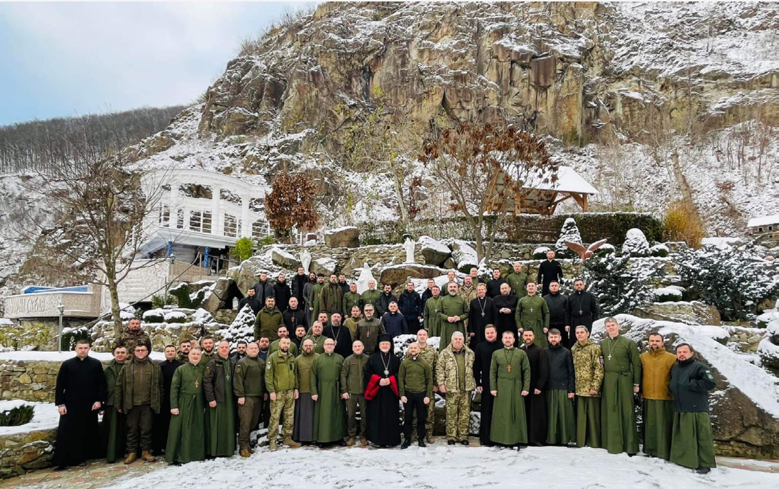
XVI Всеукраїнський з'їзд військових капеланів УГКЦ